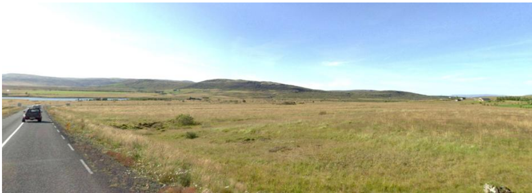
Mynd 1: Skipulagssvæðið séð niður af Búrfellsvegi.

Skipulag þetta er í samræmi við aðalskipulagsbreytingu sem auglýst er samhliða deiliskipulaginu og nær til lóða 2-12 við Herjólfsstíg, lóðar Óðinsstíg 1 og þjónustulóðar við Búrfellsveg. Við síðustu endurskoðun Aðalskipulags Grímsnes- og Grafningshrepps var hluti af skipulagssvæðinu færður úr landnýtingarflokki Frístundabyggð í landnýtingarflokk Landbúnaðarsvæði 2 , en með breytingunni er svæðið skilgreint sem verslunar- og þjónustusvæði.