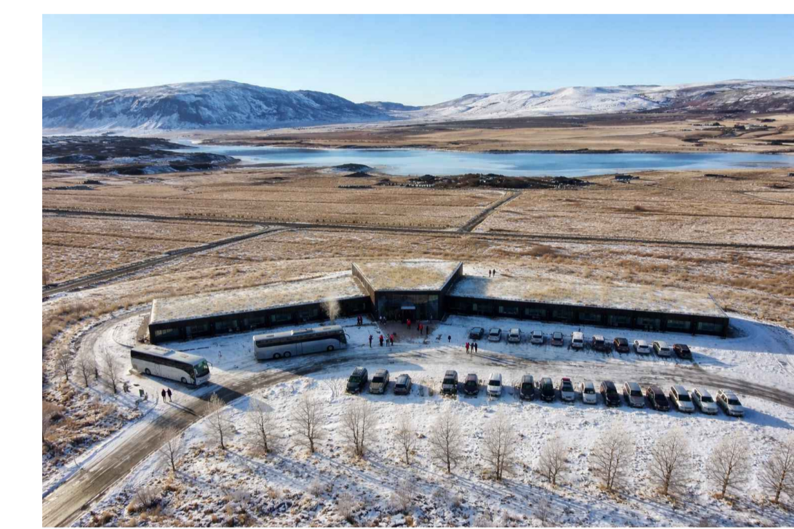
Mögulegt útlit hótels, séð úr lofti úr austri