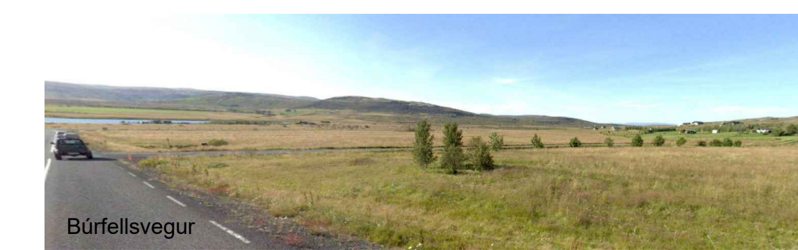
Yfirlitsmynd af svæðinu

Deiliskipulag þetta sem auðlýst hefur verið skv. 1.mgr. 41.gr. skipulagslaga nr. 123/2010 frá _____ til _____ var samþykkt í sveitarstjórn þann _____