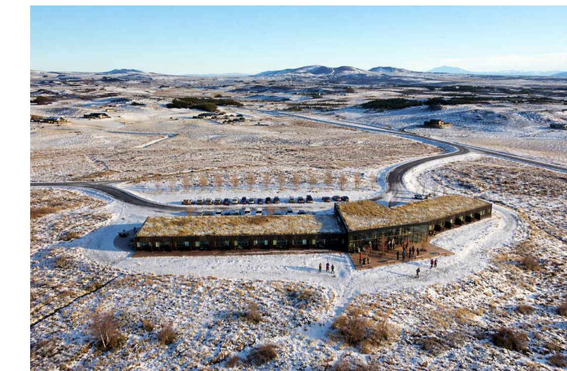
Mögulegt útlit hótels, séð úr lofti úr vestri