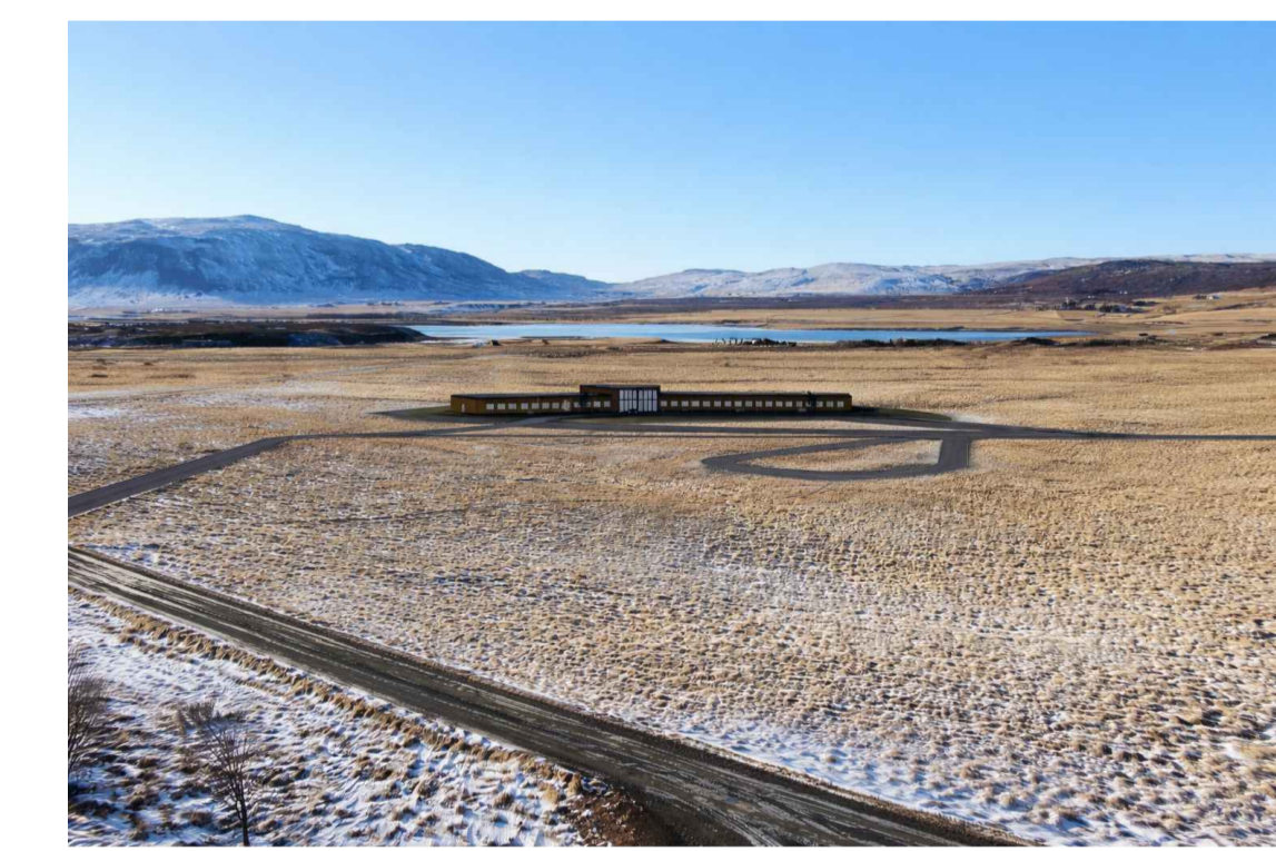
Mögulegt útlit hótels, séð frá vestri