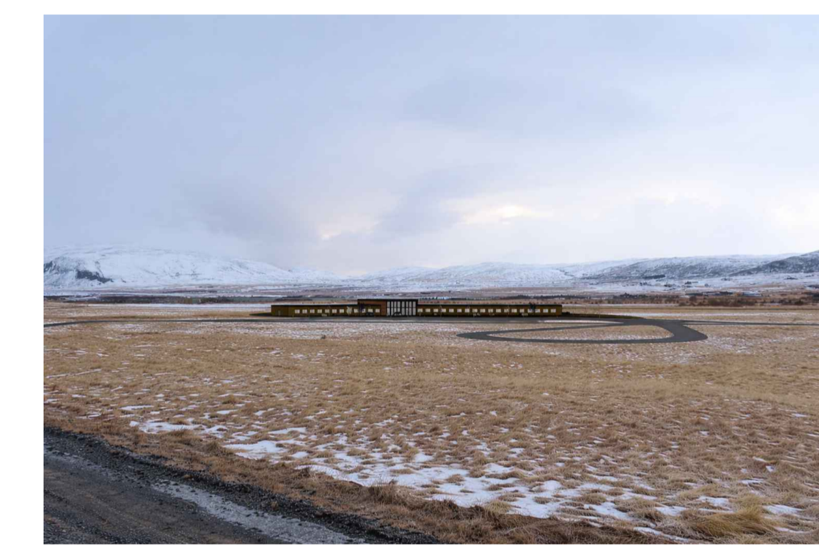
Mögulegt útlit hótels, séð frá austri