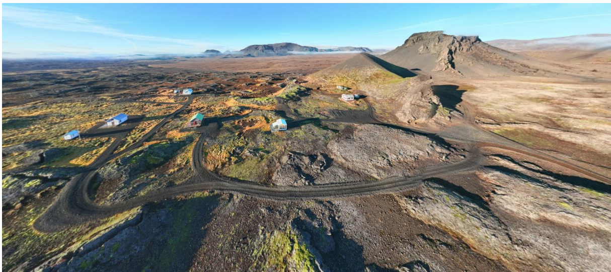
MYND 1. Sjó af skálunum við Tjaldafell. Ekki sér í skála austan fellsins.

Samhliða er unnið að breytingu á aðalskipulagi og er deiliskipulagið í samræmi við það. Við gildistöku nýs deiliskipulags fellur eldra deiliskipulag úr gildi.