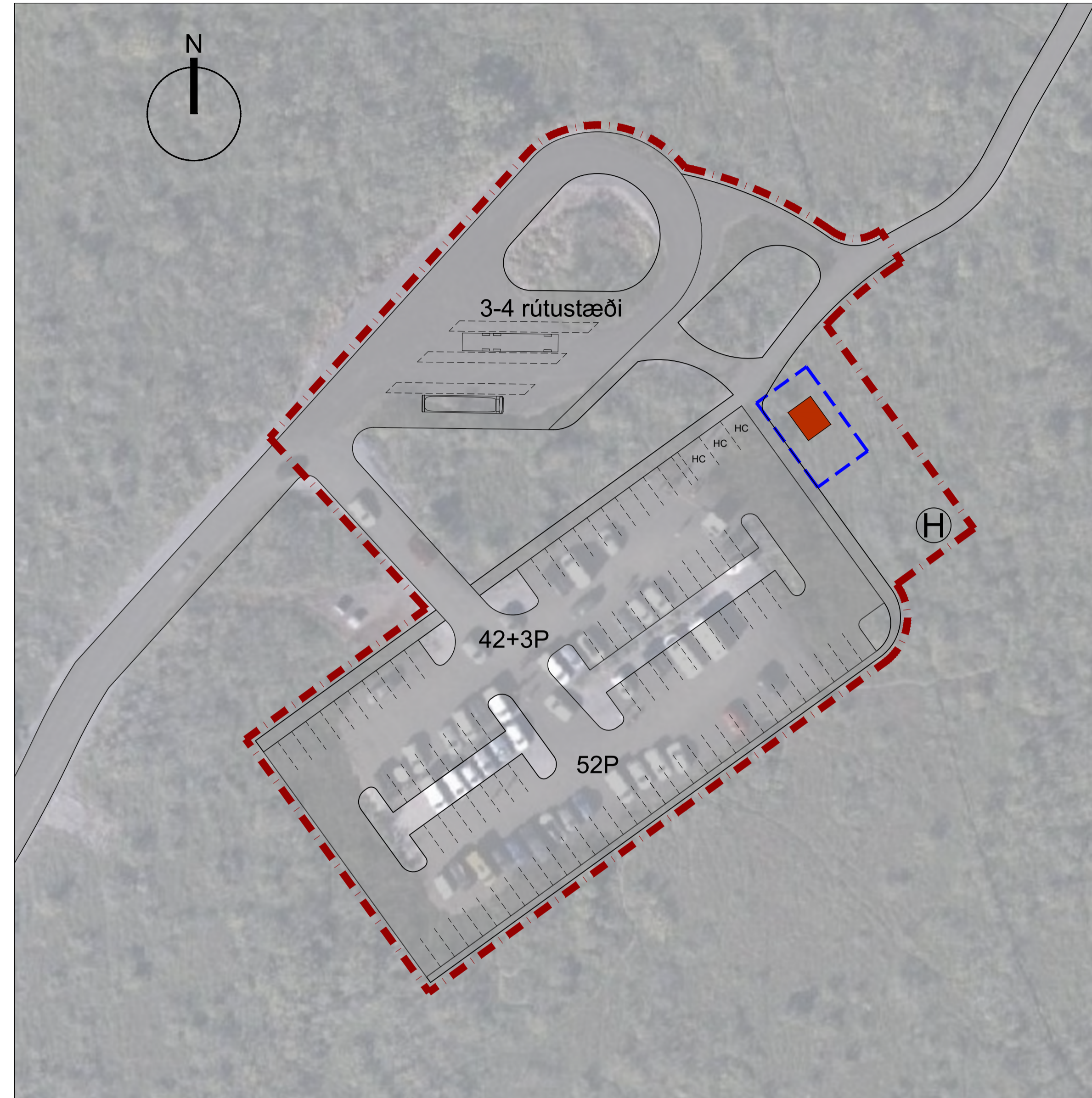
Skipulagsuppráttur, mkv. 1:500.