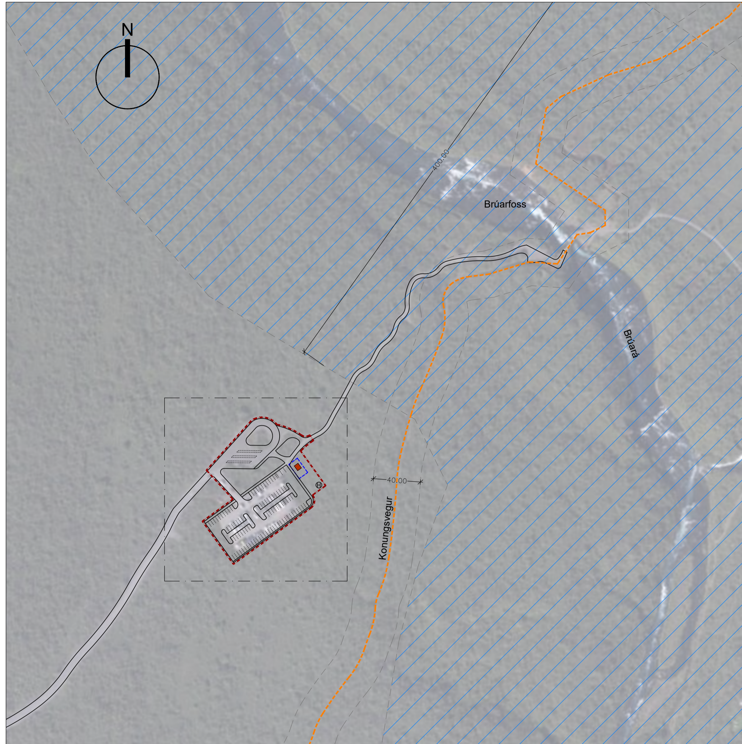
Afstöðumynd, mkv. 1:2000.