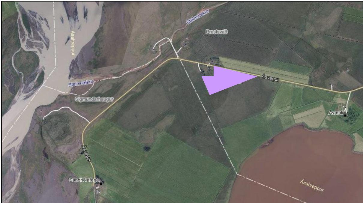
Mynd 1: Skipulagssvæðið sýnt á loftmynd. Ekki í kvarða.

Í skipulagslýsingu þessari er gerð grein fyrir fyrirhugaðri breytingu á Aðalskipulagi Ásahrepps 2020 – 2032 og innihaldi deiliskipulags fyrir landnotkunarreitinn, sem unnið verður samhliða breytingu á aðalskipulagi. Tillögurnar verða kynntar og auglýstar samhliða. Í lýsingu koma fram upplýsingar um forsendur, stefnu og fyrirhugað skipulagsferli.