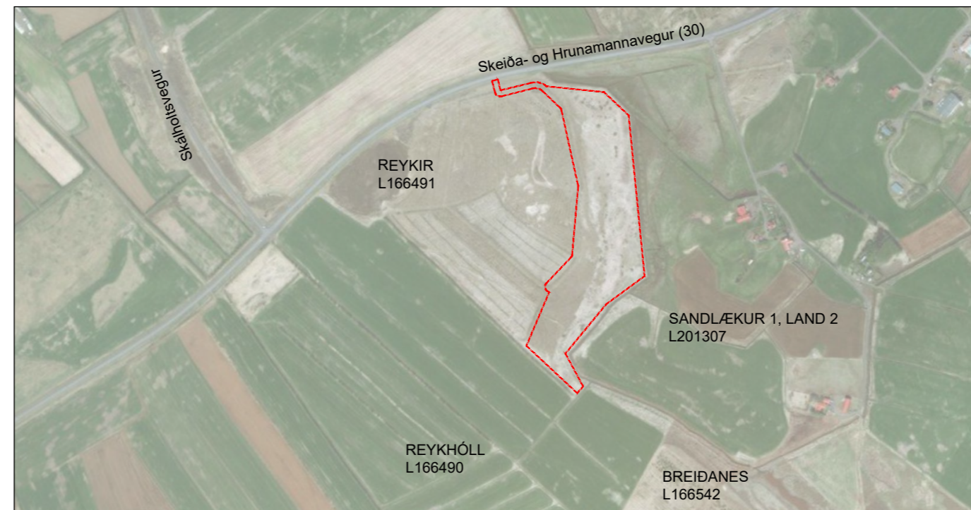
Afstöðumynd. Mkv.: 10.000

Við breytingu á aðalskipulagi, sem var unnin í aðdraganda deiliskipulags þessa, voru umhverfisáhrif metin, svo sem Landslag og ásjúnd lands, Menningarminjar, Náttúruminjar, Heilsa og Öryggi, Byggð og efnisleg verðmæti, Útivist og Fuglalíf . Áhrif á samfélag voru metin jákvæð og áhrif á vistkerfi nokkur, en hvorki jákvæð né neikvæð.