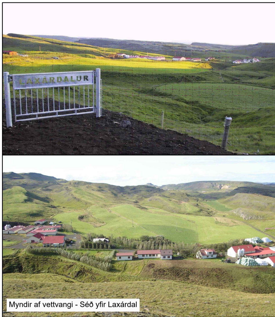
Myndir af vettvangi - Séð yfir Laxárdal

ALMENNT: Byggingareitirnir sex eru afmarkaðir á hnitsettum uppdrætti. Mænistefna, þakhalli, form og gerð húsa eru gefin frjálts. Uppbygging mannvirkja innan byggingareitna sætur ekki frekari skilmálum en þeim sem gilda um landbúnaðarland í aðalskipulagi sveitarfélagsins auk ákvæða gildandi byggingareglugerðar. Samkvæmt skilmálum þessum er heimilt heildarbyggingarmagn innan skipulagssvæðisins sem er 6.74 hektarar um 6850 m 2 .