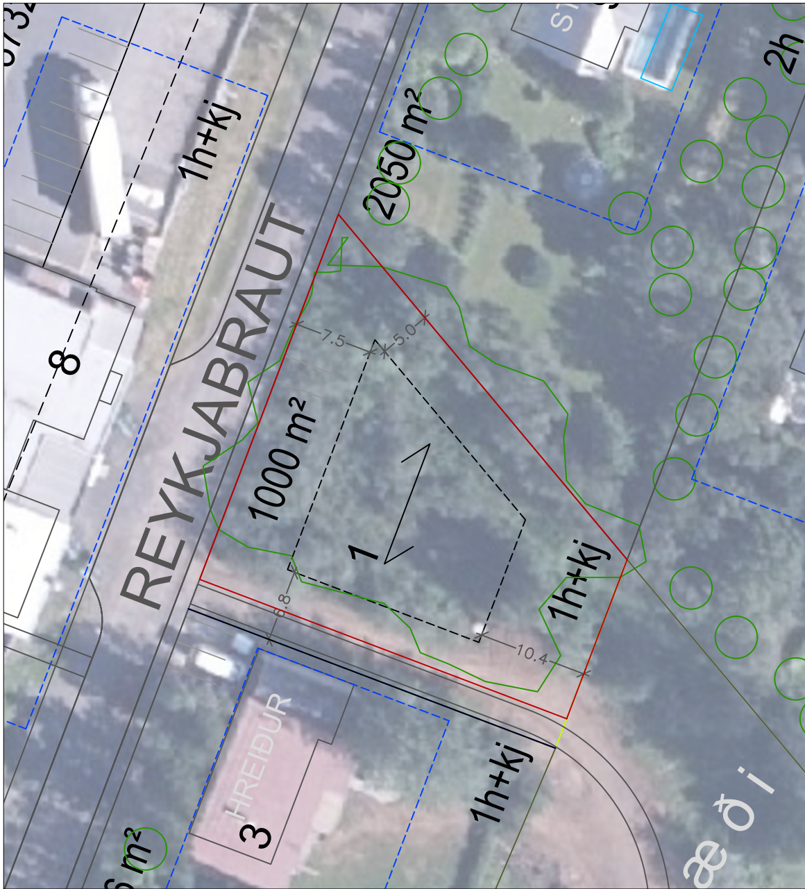
Deiliskipulag fyrir breytingu