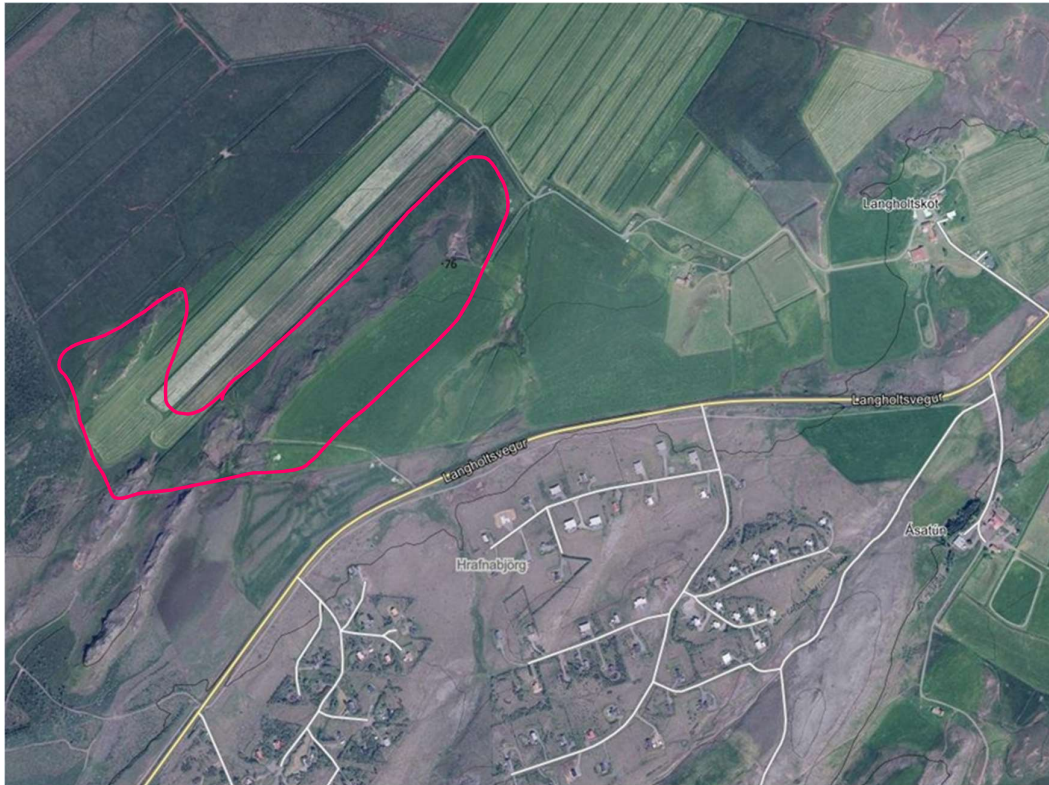
Mynd 2 Skipulagssvæðið afmarkað með rauðri línu, stærð um 24 ha.