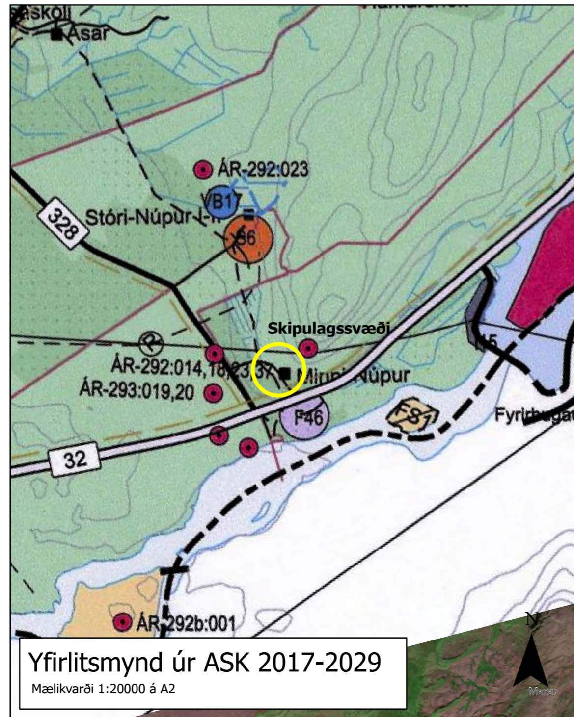
Yfirlitsmynd úr ASK 2017-2029 Mælikvarði 1:20000 á A2