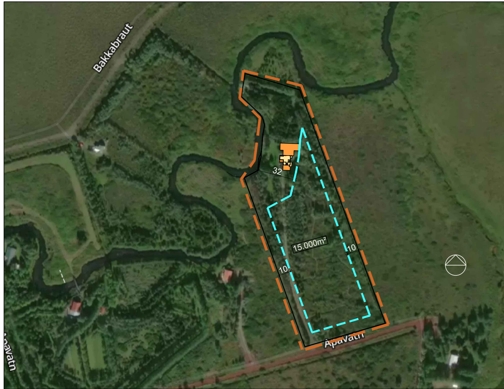
Deiliskipulag, eftir uppfærslu - mkv.1:2000