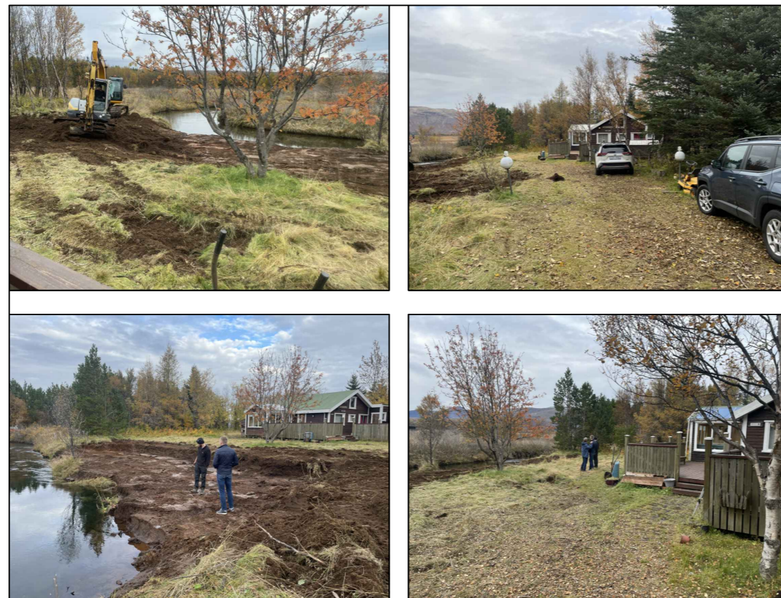
Sólgarður, núverandi sumarhús á lóð stendur 16 m frá lækjarbakka.

Auk stækkunar og viðbyggingar núverandi sumarhúss, er gert ráð fyrir tveimur viðbótá húsum á lóðinni í framtíðinni, 40m² gestahúsi og 15m² geymsluhúsi, til samræmis við aðalskipulag Bláskógabyggðar. Þau skal staðsetja í a.m.k. 32 m fjarlægð frá árbakka.