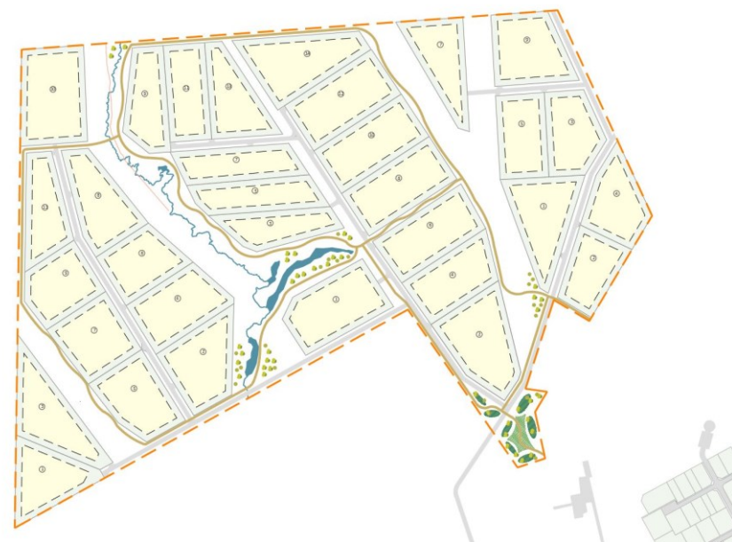
Mynd 3 Afmörkun lóða úr deiliskipulagsuppdrætti.

Það land sem deiliskipulagið nær til er um 54,8 ha og er í dag skilgreint sem landbúnaðarsvæði (L3). Samkvæmt aðalskipulagi eru þetta svæði með rúmum byggingarheimildum þar sem heimilt er að byggja litlar landspildur til fastrar búsetu, heimilt er að vera með landbúnaðarstarfsemi og minniháttar atvinnustarfsemi sem er jafnvel ótengd landbúnaði og hæfir stærð hvers lóðar. Gert er ráð fyrir 32 lóðum, á stærðarbilinu 0,9 – 1,5 ha.