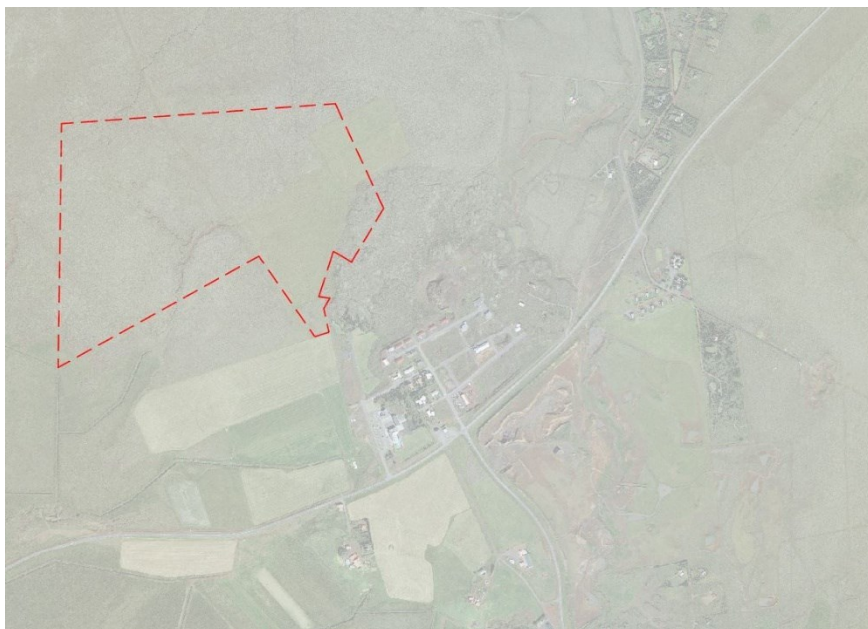
Mynd 1 Yfirlitsmynd af skipulagssvæðinu.

Borgarheiði er staðsett skammt frá þéttbýliskjarnanum Borg í Grímsnesi sem hefur á undanförunum árum verið í miklum vexti samhliða fjölgun íbúa og ferðamanna á Suðurlandi. Aukin eftirspurn er eftir íbúðarlóðum í sveitarfélaginu þar sem sífellt fleiri kjósa að búa í dreifbýli, með gott rými í kringum sitt sérbýli, hafa gott útsýni og meiri nálægð við náttúruna og þau lífsgæði sem hún hefur upp á að bjóða.