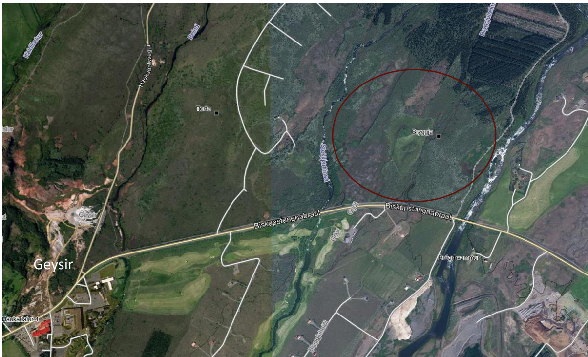
MYND 1. Bryggja er innan rauða hringsins og liggur að Tungufljóti, Biskupstungnabraut, Almenningsá (merkt Stekkjartúnsá á mynd) og Haukadalsskógi. Mynd af map.is.