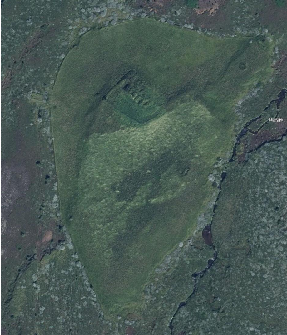
MYND 3. Minjasvæði í Bryggju, sem sést á loftmynd.