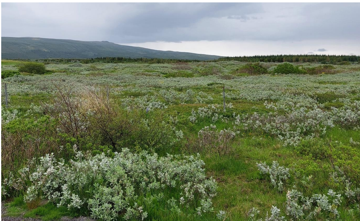
MYND 2. Horft yfir hluta skipulagssvæðisins í Bryggju. Sér í Haukadalskóg ofan við miðja mynd.