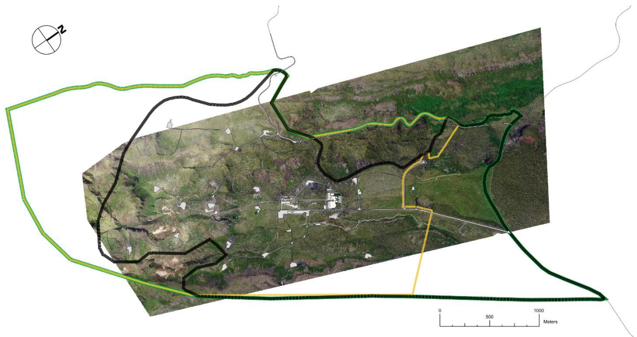
Mynd 1 Gul lína sýnir núverandi skipulagsmörk, græn er áætluð afmörkun deiliskipulagsins, svört lína er afmörkun iðnaðar- og orkuvinnslusvæðisins. Líurnar liggja saman á stórum kafla.

Innan deiliskipulagsins eru svæði sem eru bundin ýmsum verndarákvæðum svo sem grannsvæði og brunnsvæði vatnsverndar og hverfisvernd. Allt skipulagssvæðið er innan vatnasviðs Þingvallavatns og er á Nesjahrauni sem nýtur verndar skv. 61.gr. náttúruverndarlaga. Á svæðinu er einnig að finna eldvörp, gervigíga og hverji sem njóta sérstakrar verndar samkvæmt sömu lagagrein. Sjá nánar í kafla 3.1 hér á eftir.