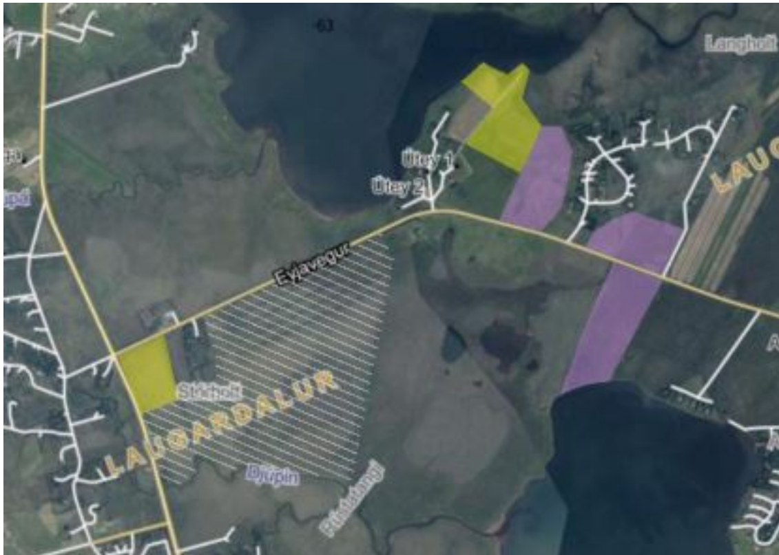
Mynd 1. Yfirlitsmynd yfir skipulagssvæðið, gult sýnir svæði fyrir verslun- og þjónustu, fjólublár fyrir stækkun á frístundabyggð og hvítar skástrikaðar línur fyrir búgarðabyggð.