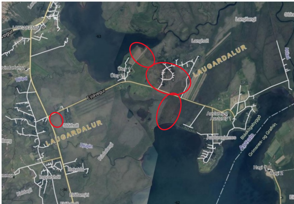
Mynd 2. Staðsetning aðalskipulagsbreytinga á loftmynd.

Breyting aðalskipulags tekur alls til um 95 ha stærðis. Megin forsenda fyrir breytingu aðalskipulagsins er að stækka svæðið sem skilgreint er sem frístundabyggð og bæta við landnotkun fyrir verslun og þjónustu. Markmiðið með breytingunni er að nýta tækifæri sem jörðin hefur upp á að bjóða í tengslum við ferðapjónustu. Allir innviðir bjóða upp á frekari uppbyggingu á svæðinu, nóg er af heitu og köldu vatni á jörðinni. Jörðin er staðsett við „gullna hringinn“ og því stutt í allar helstu náttúruperlur Suðurlands og gott útsýni yfir Laugarvatn og til fjalla. Veiðihlunnindi er á jörðinni og góðar aðstæður til fugla- og náttúruskoðunar. Breytingin samræmist stefnumótun sveitarfélagsins fyrir ferðapjónustu þar sem hún styður við fjölgun ársverka í ferðapjónustu og eykur tekjur af ferðamönnum.