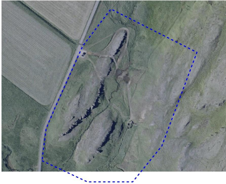
staðsetning fyrirhugaðs skipulagssvæðis á loftmynd.

Meginmarkmið fyrirhugaðrar deiliskipulagstillögu er að tryggja að svæðið geti með öruggum hætti tekið á móti þeim fjölda gesta sem leggja leið sína um svæðið, án þess að minjar og náttúra þess verði fyrir skemmdum vegna ágangs. Skipulagið tryggir aðstöðu fyrir staðarhaldara til að taka á móti gestum og sinna eftirliti og umsjón svæðisins. Markmið deiliskipulagsins er að byggja upp lítið þjónustuhús til að þjónusta móttöku gesta við Hrunalaug.