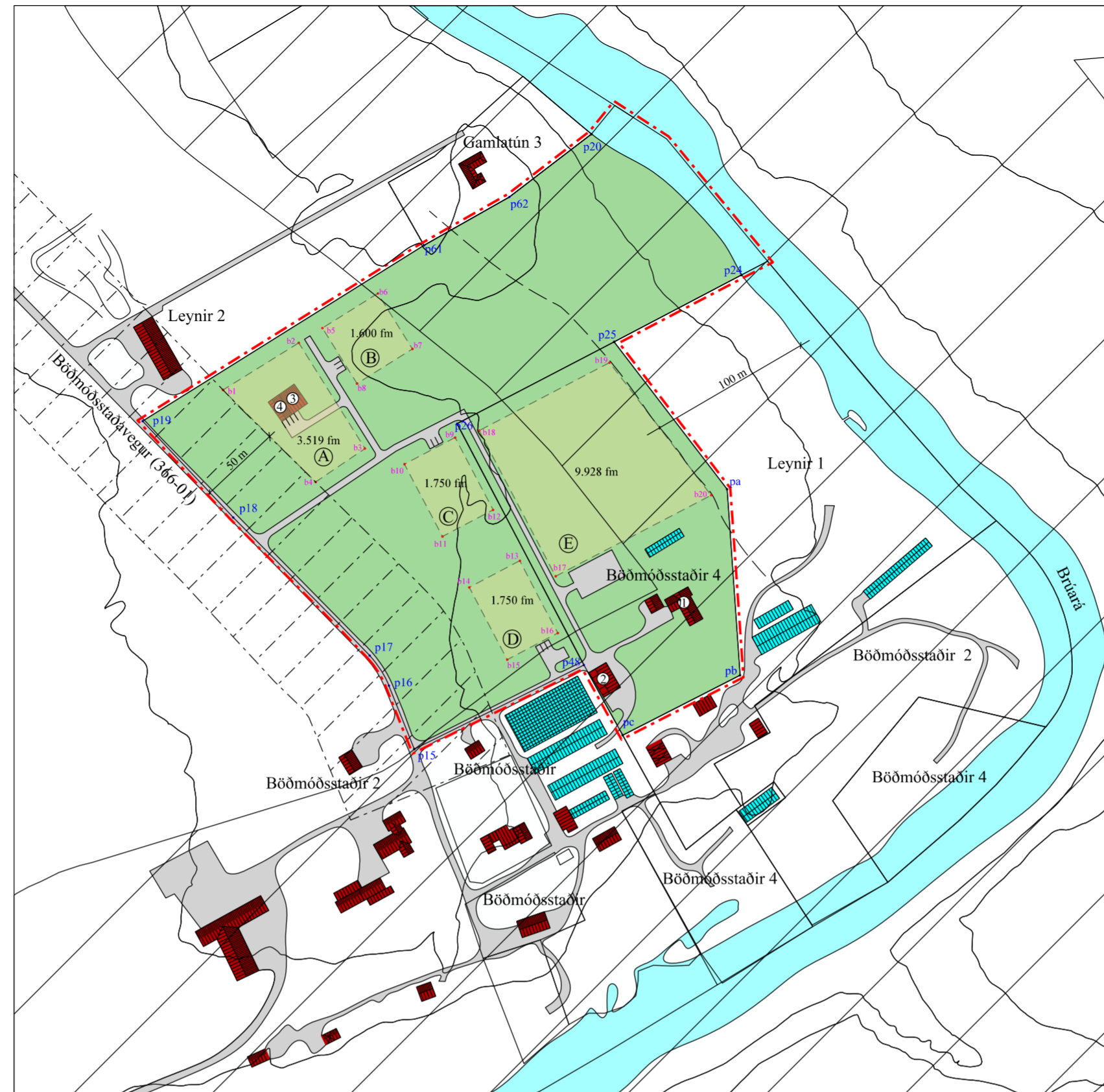
Deiliskipulag mkv. 1 : 3.000 (A2)

Hnit lóðar: p15: X=424249.19 Y=412663.34 p16: X=424233.68 Y=412702.13 p17: X=424221.84 Y=412720.57 p18: X=424138.34 Y=412805.08 p19: X=424082.95 Y=412864.03 p20: X=424357.63 Y=413039.63 p24: X=424449.40 Y=412953.40 p25: X=424371.52 Y=412912.51 p26: X=424275.38 Y=412862.42 p48: X=424553.01 Y=412714.76 p61: X=424255.17 Y=412971.57 p62: X=424307.34 Y=413001.17 pa: X=424440.65 Y=412822.33 pb: X=424448.61 Y=412708.51 pc: X=424376.76 Y=412671.84