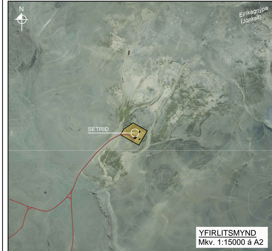
YFIRLITSMYND Mkv. 1:15000 á A2

BREYTINGAR: 5.2.2023 - Að lokinni kynningu: Aukið við texta sem varðar umfanginn um Friðlandið í Þjórsárverum. Heimild fyrir þursalerni.