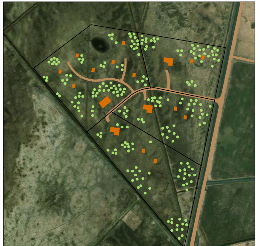
Skýringamynd með gildandi deiliskipulagi aðliggjandi lóða ásamt drögum að skipulagi svæðis fyrir gistihús og ferðaþjónustu

Aðalskipulagsbreyting þessi sem auglýst hefur verið samkvæmt 36. gr. skipulagslaga nr. 123/2010, með síðari breytingum, var samþykkt af sveitastjórn Flóahrepps þann