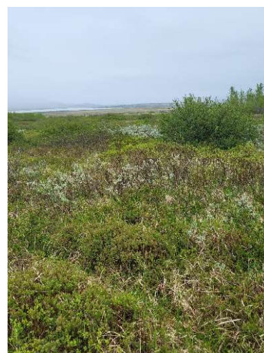
Mynd 4. – myndir sýna gróðurfar á svæðinu á ólíkum árstíma.