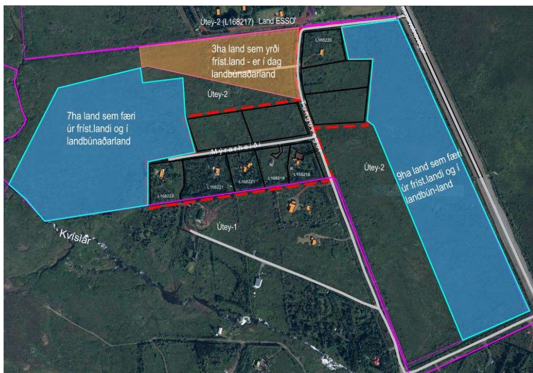
Mynd 2. Yfirlitsmynd yfir skipulagsreit vestan Laugarvatnsvegur