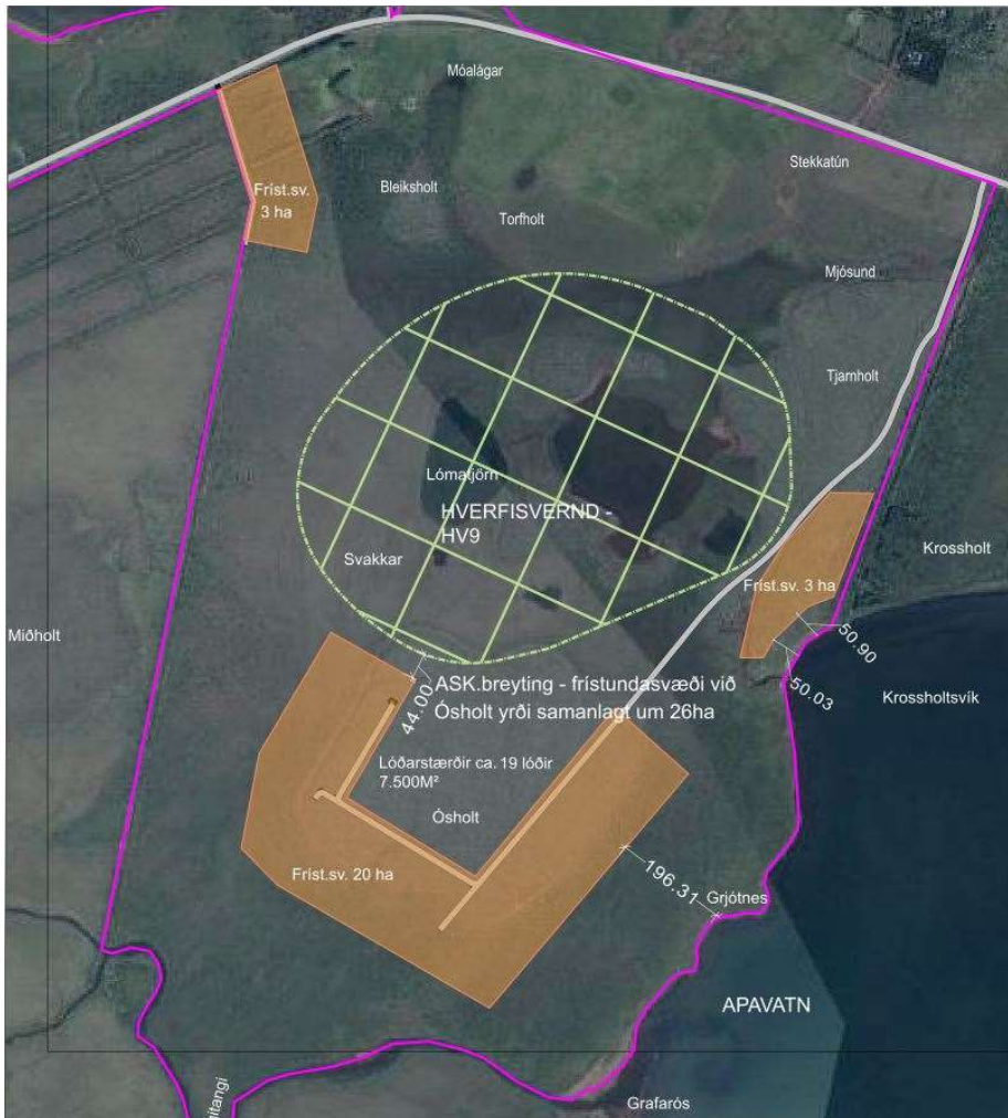
Mynd 2. Yfirlitsmynd yfir skipulagsreiti við Apavatn

Breyting aðalskipulagsins felst í því að sýna 3 ný frístundahúsasvæði sem samanlagt yrðu um 26ha að stærð og stefnt er að því að hver lóð verði um 7.500m 2 að stærð. Svæðin eru sýnd sem ljósbrúnir flákar á mynd 2 hér að neðan. Á þessum svæðum er gert ráð fyrir allt að 30 lóðum.