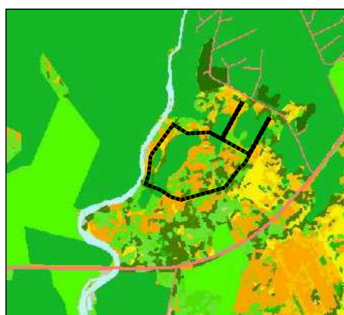
Skipulagssvæðið sýnt á vistgerðarkorti Náttúrufræðistofnu Íslands. Mkv. 1:25.000

Meðferð jarðvegs Vegna víðkvæmra vistgerða á svæðinu skal halda raski í algjöru lágmarki og takmarka umfang jarðvegsskipta, vega- og bílastæðagerðar og grasflata eins og kostur er. Við uppróft skal leggja til hliðar og varðveita sérstaklega efsta lag jarðvegs, og nota það til yfirlagnar á röskuðu landi. Landeigandi skal leggja áherslu á vel útbúin leiksvæði og flatir til leikja á opnum svæðum, til að lágmarka þörf á slíku innan lóða. Veitur og þjónusta Svæðið tengist Laugarvatnsvegi [37] um núverandi vegtengingu. Gert er ráð fyrir að nýjar byggingar tengist dreifikerfi RARIK. Neyslavtun kemur frá einkaveitu Efri-Reykja, sem fær vatn ofan af Hróthagaheiði. Brunavarnir Arnessýslu þjónusta svæðið með slökkviliði. Ef veitukerfi anna ekki nægu slökkvavatni skal úr bætt í samráði við eldvarnaftirlit B. Á. Heitt vatn kemur frá einkahitaveitu Efri-Reykja, sem fær vatn úr borholu á jörðinni. Frárennslu frá byggingum skal leitt í lifrænt hreinsivirki. Tryggt aðgengi skal vera að hreinsivirkinu, til tæmingar og viðhalds. Að öðru leyti skal fyrirkomulag veitu- og frárennsliskerfa vera í samræmi við reglugerð og leiðbeiningar sem um slíkar framkvæmdir gilda. Sorp Um sorphirðu fer eftir reglum sveitafélagsins hverju sinni.