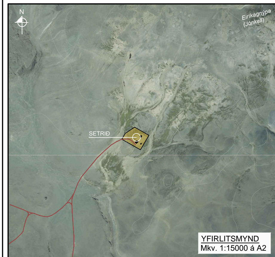
YFIRLITSMYND Mkv. 1:15000 á A2