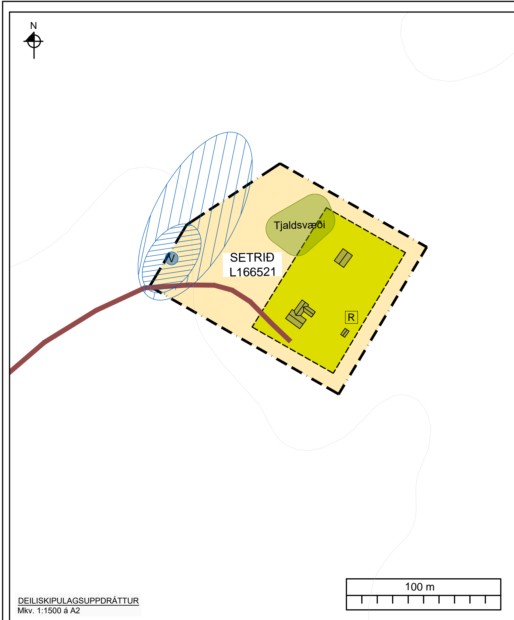
DEILISKIPULAGSUPPRÁTTUR Mkv. 1:1500 á A2