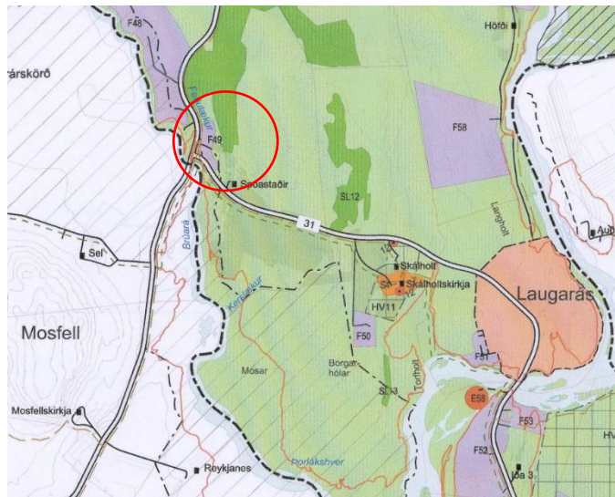
MYND 1. Hluti af Aðalskipulagi Bláskógabyggðar 2015-2027. Fyrirhuguð breyting er innan rauða hringins.

Með því að rýmka heimildir til uppbyggingar er verið að styðja við styrkingu byggðar á svæðinu með því að fjölga tækifærum til fastrar búsetu sem samræmist stefnu aðalskipulags um að stuðla að farsælli byggðapróun í sveitarfélaginu. Svæðið er vel staðset hvað varðar veitur og vegi í sveitarfélaginu og því um hagkvæma nýtingu innviða að ræða.