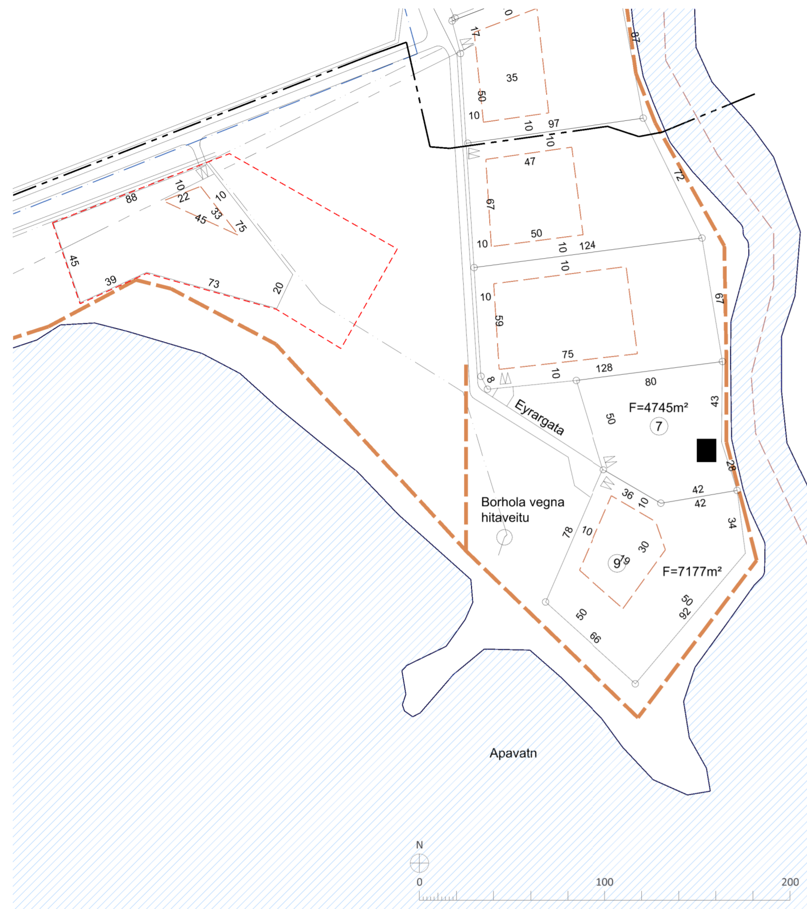
HLUTI GILDANDI DEILISKIPULAGSUPPRÁTTAR 1:2.000. Staðfest 7. júní 2002, m.s.br.