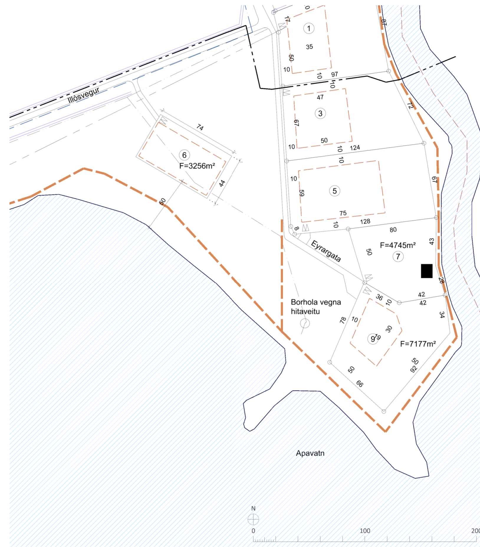
BREYTTUR DEILISKIPULAGSUPPRÁTTUR 1:2.000