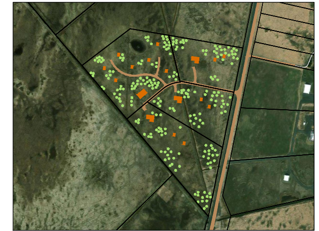
Skýringamynd með gildandi deiliskipulagi, lóðir og mögulegur húsakostur. Mkv. 1:10.000