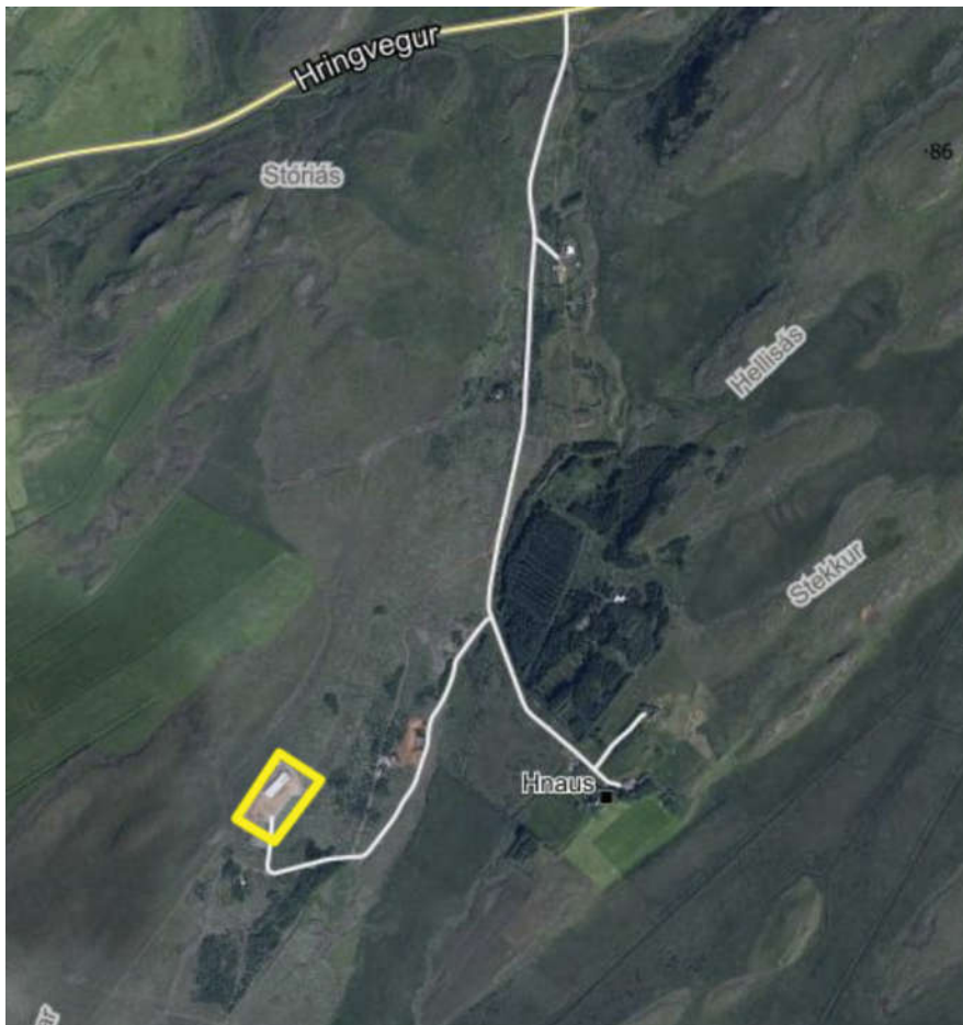
MYND 1. Skipulagssvæðið er innan gula rammans.