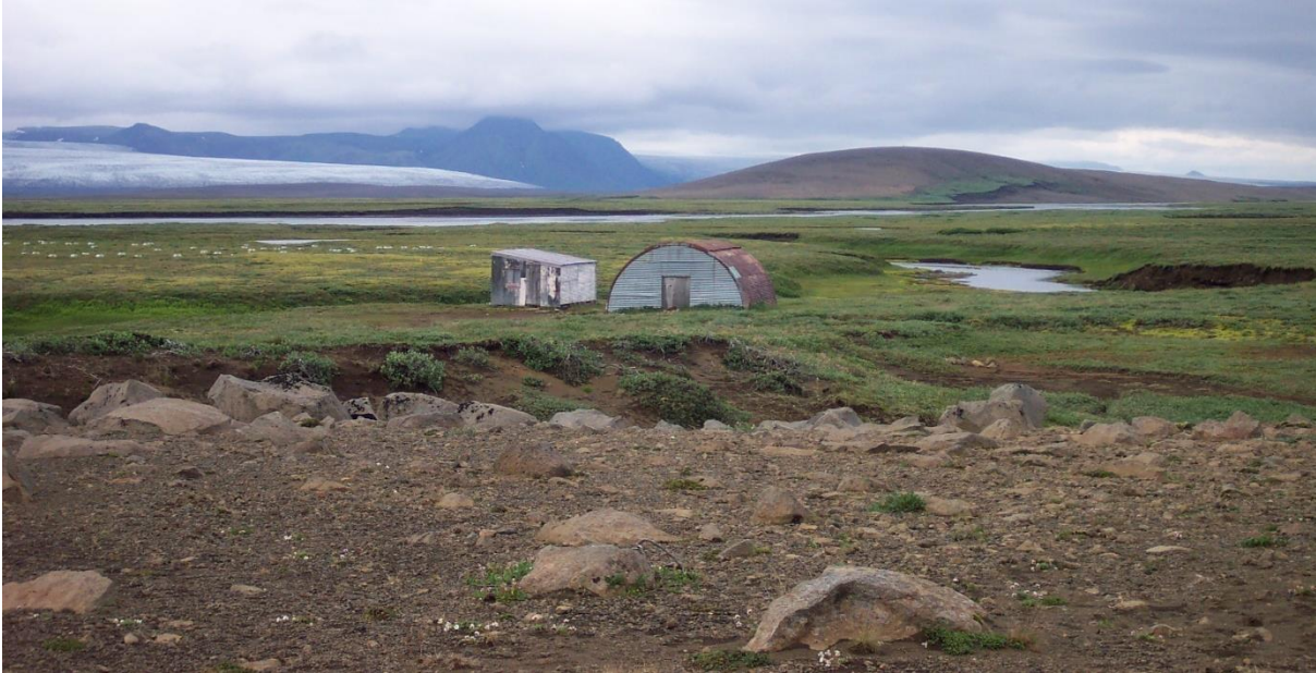
MYND 4. Gásagustur í Þúfuveri. Gistiskáli t.v. og hesthús t.h.

Svæðið umhverfis leitarmannahús og hesthús er vel gróið en móelhúsið er á gróðurlausum mel.