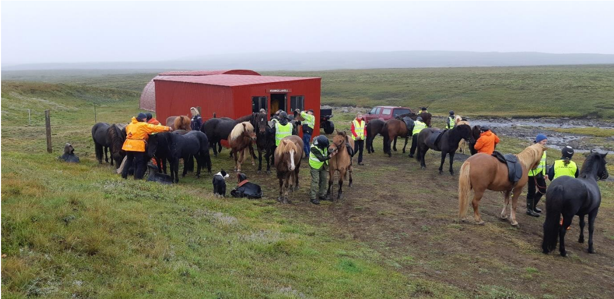
MYND 2. Hvangiljahöll. Gistiskáli nær og hesthús fjær.

Versalir eru sunnan við Stóraver og við sunnanverða Kvíslaveitu. Hús standa skammt frá Sprengisandsleið (F26). Versalir eru skráðir í Þjóðskrá undir heitinu Stóraver og eru öll mannvirki á landnúmerinu 165351.