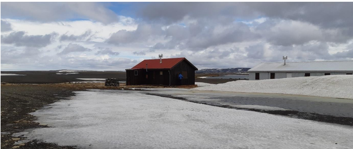
MYND 3. Gistiskálarnir tveir í Versölum.

Svæðið er lítt gróið, að mestu leyti melar og grjót. Unnið hefur verið að uppgræðslu umhverfis húsinn allt frá því þau voru byggð, en gróðurþekja er rýr.