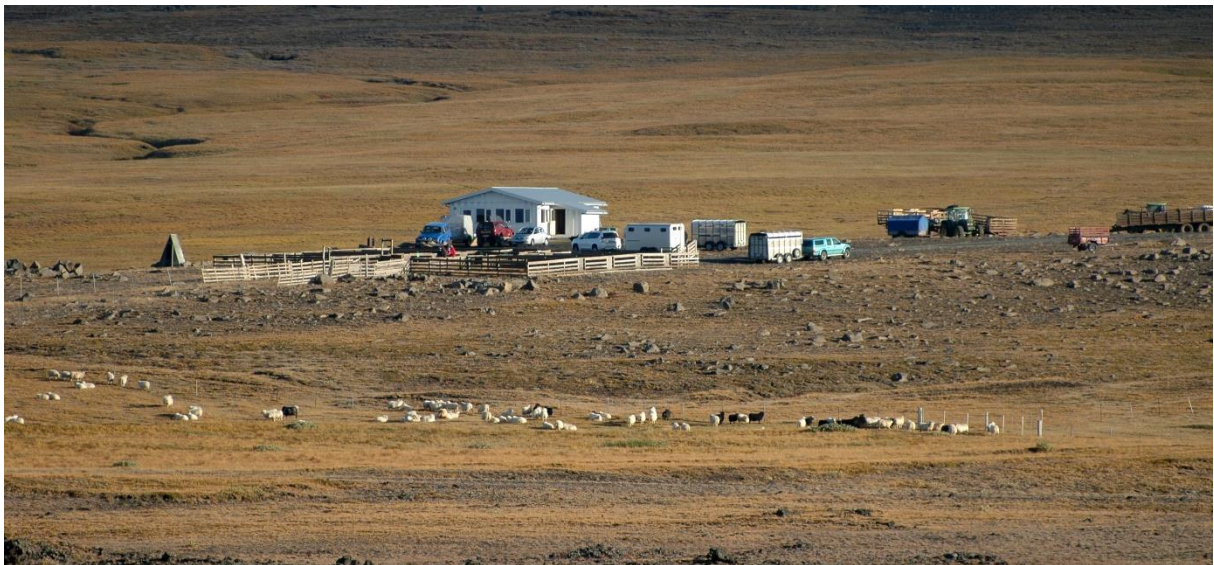
MYND 1. Hald og Haldrétt.

Svæðið næst skálanum er lítt gróið, melur og grjót. Unnið hefur verið að uppgræðslu í nágrenninu undanfarin ár. Fremst á Búðarhálsi eru ekki þekkt náttúrufyribæri sem njóta sérstakrar verndar.