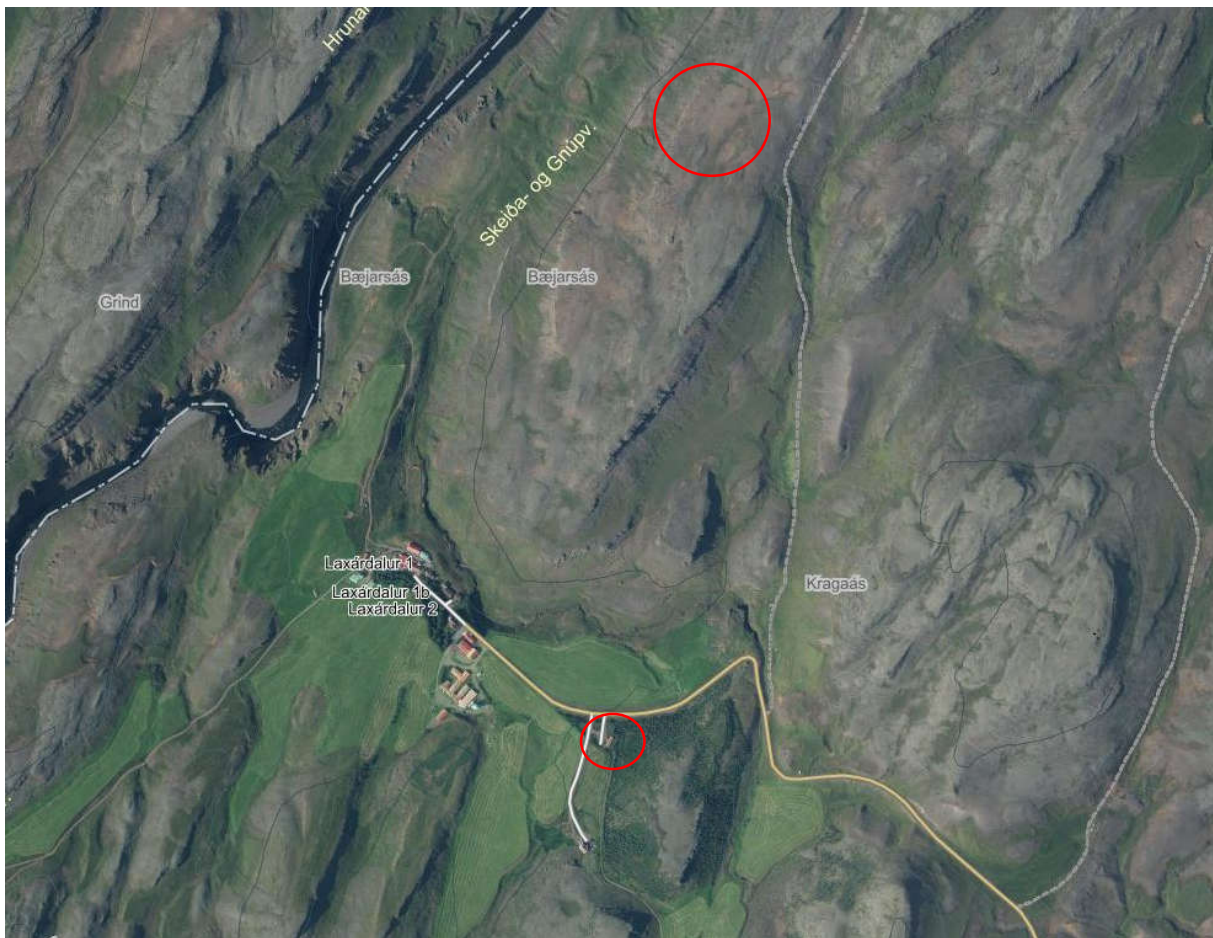
Mynd 1. Staðsetning afþreyingar- og ferðamannasvæðisins er innan rauðu hringanna (map.is)

Aðkoma að svæðinu er norðan frá Gnúpverjavegi (nr. 325) um Mástunguveg (nr. 329).