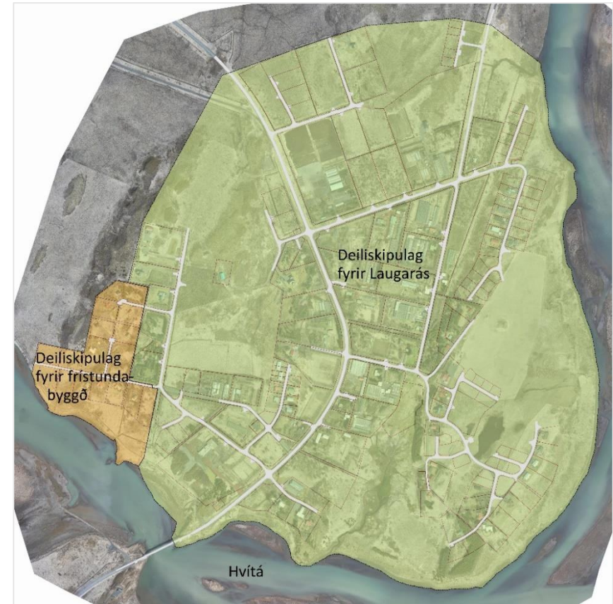
Mynd 1. Yfirlitsmynd yfir mörk deiliskipulags fyrir þéttbýlið Laugarás og frístunda-byggðina F51 vestan þéttbýlisins.

Nýtt deiliskipulag fyrir Frístundasvæðið F51 er sett fram í greinagerð þessari og á upprætti.