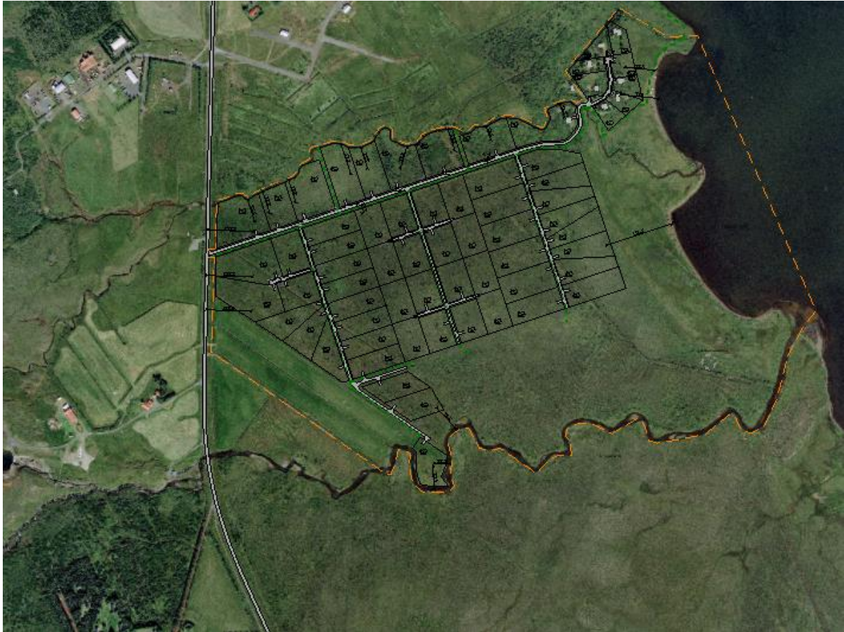
MYND 1 Yfirlitsmynd af svæðinu.

Svæðið er að hluta til inn á náttúruverndarsvæði Laugarvatns og undir hverfisvernd. Á vestanverðu svæðinu eru tún en austan við þau er meirihluti svæðisins er birkikjarr samkvæmt vistgerðarflokkun Náttúrufræðistofnunar Íslands.