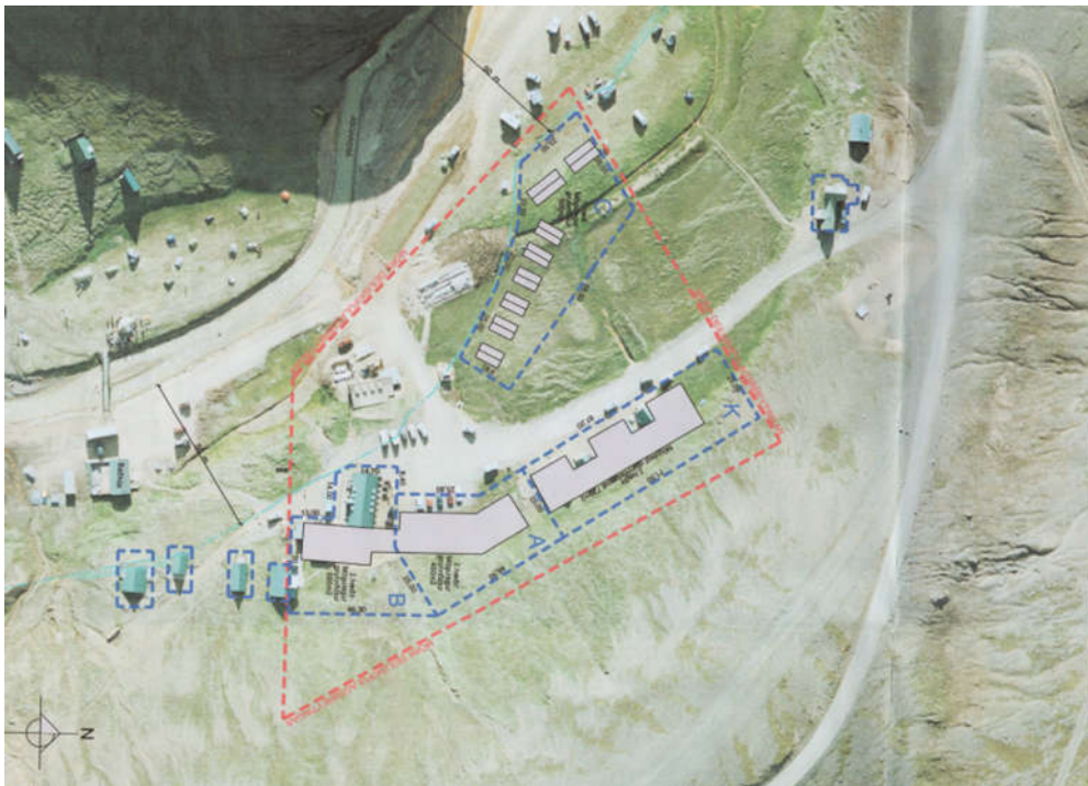
MYND 7. Deiliskipulagsbreyting frá árinu 2015.