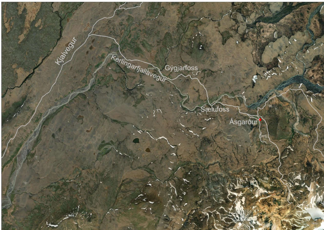
MYND 3. Núverandi aðkoma að Ásgarði.

Í þessu deiliskipulagi er gatnamótum frá Kerlingarfjallavegi inn að Ásgarði breytt eins og sjá má á skipulagsupprætti. færsla gatnamótanna er til að færa veginn fjær mannvirkjum (Ferðafélagshúsinu og hesthúsinu) en einnig vegna þess að yfir vetrarmánuði skefur snjó í þessi gatnamót sem hefur skapað hættu. Gatnamótin að Ferðafélagshúsinu verða óbreytt en það verður ekki hægt að keyra þaðan inn í Ásgarð.