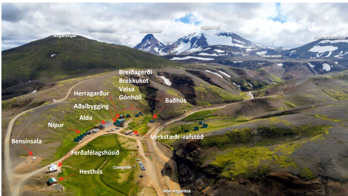
MYND 2. Yfirlitsmynd frá árinu 2015 með nöfnum mannvirkja.