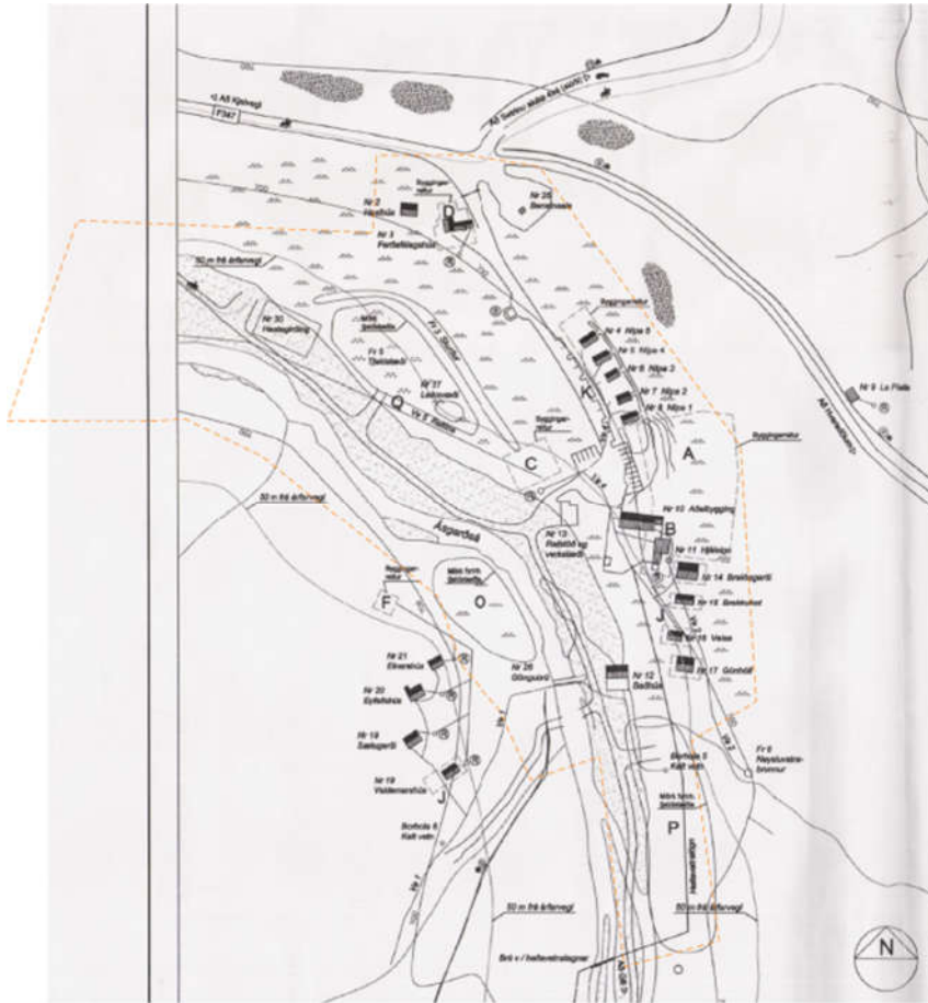
MYND 6. Gildandi deiliskipulag fyrir svæðið frá árinu 2014. Svæðið sem felld verður úr gildi með staðfestingu nýs deiliskipulags er innan lítaða rammans.