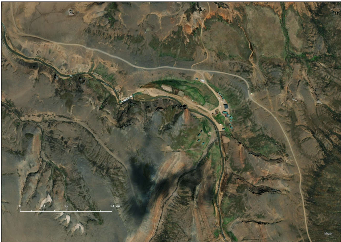
MYND 1. Loftmynd af Ásgarði og nærliggjandi svæði

Hveradölum er takmarkað útsýni, þó sjást nokkrir af helstu fjallstindum klasans, mismunandi þó eftir því hvar staðið er í dalnum. Af þessu leiðir að staðsetning núverandi og fyrirhugaðra bygginga í Ásgarði ákjósanleg þar sem þær falla vel inn í landslagið.