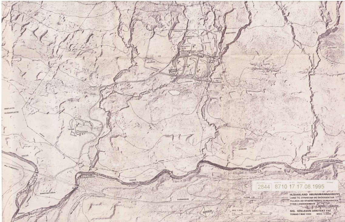
MYND 3 Deiliskipulag svæðisins frá 1995.

Skipulagið verður felld úr gildi með gildistöku þessa skipulags.