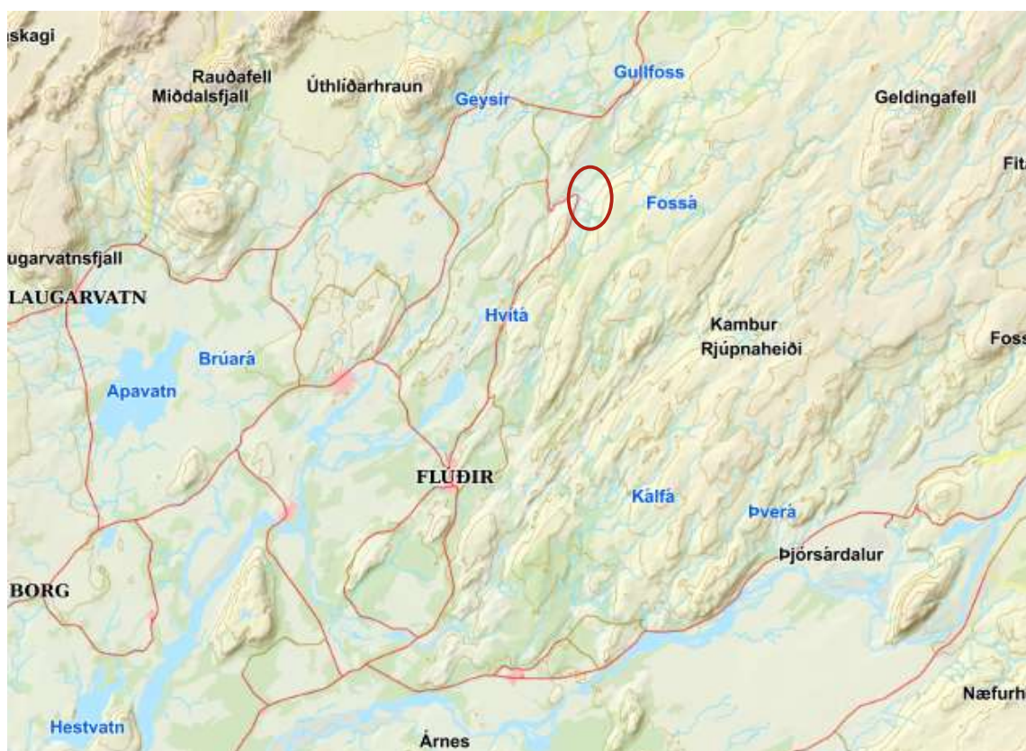
Mynd 1. Yfirlitskort, svæðið er afmarkað með rauðum hring.

Aðkoma að svæðinu er af Skeiða- og Hrunamannavegi (nr. 30), heimreið að Tungufelli/Jaðri (nr. 349) og slóða/vegi um svæðið.