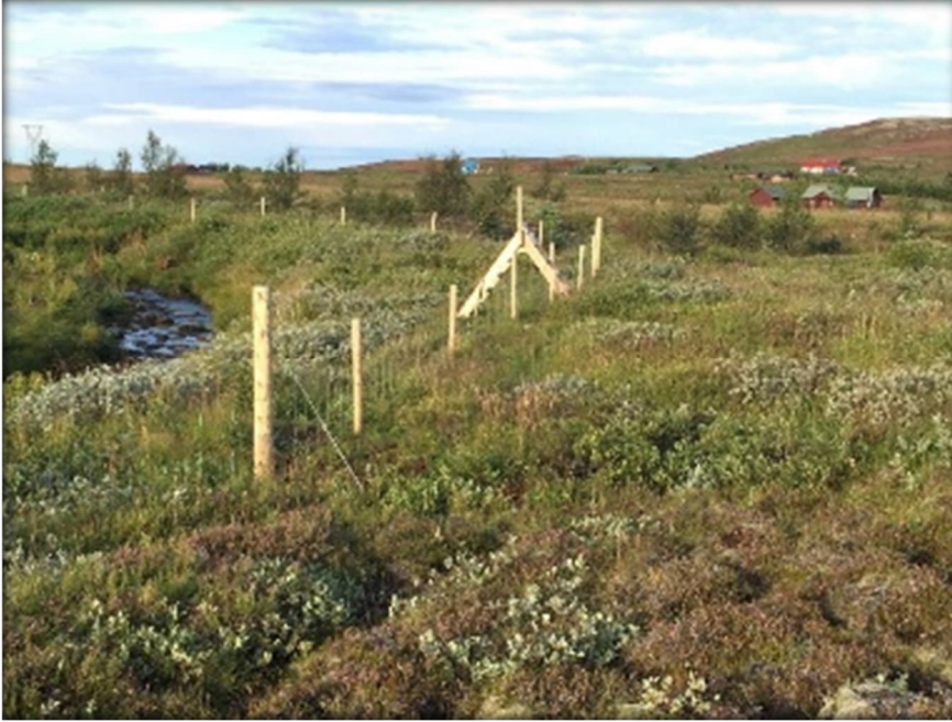
Mynd 2 Hluti af girðingu umhverfis Kerhraunið og stigi að Hæðarendalæk