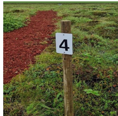
Mynd 11 Frá leik- og útivistarsvæðum