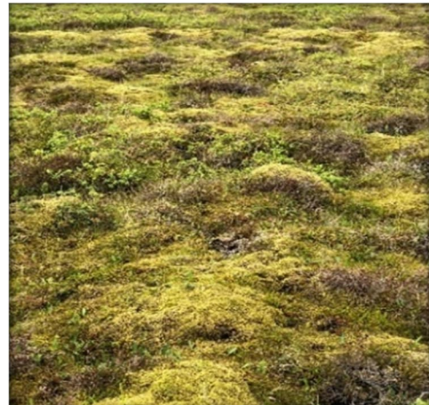
Mynd 6 Gróðurþekja- mosapembur