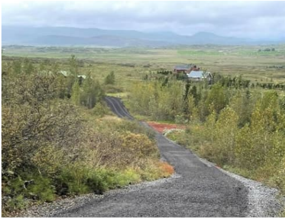
Mynd 8 Bundið slitlag og rauðamöl