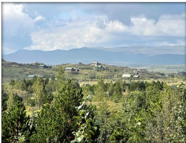
Mynd 5 Margbreytilegur gróður

Svæðið er mólendi á hrauni ásamt melum með áfoksmold. Það er að miklu leyti gróið, mosi, lyng, birki og villtur víðir sem var til staðar áður en frístundabyggðin var skipulögð. Til viðbótar hefur verið gróðursett mjög mikið af ýmsum trjátegundum, runnum og fjölbreyttum öðrum gróðri.