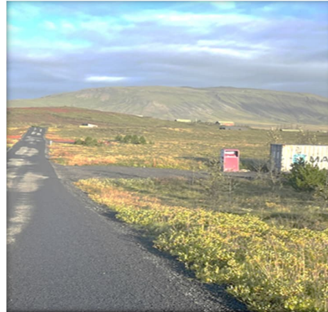
Mynd 9 Sameiginleg bíla- og geymsluplön