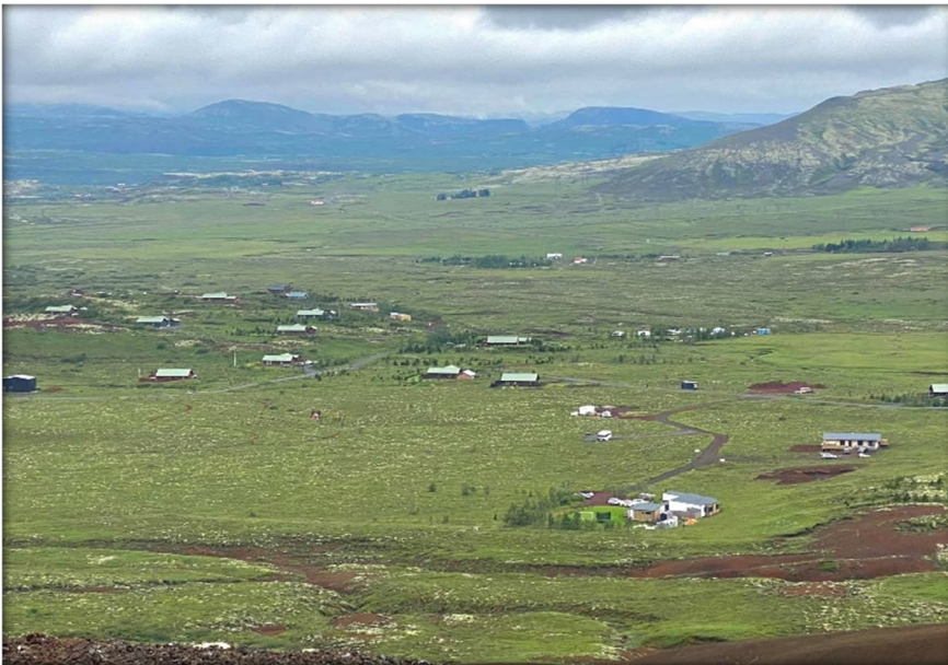
Mynd 3 Horft yfir hluta af Kerhrauni ofan af Seyðishólum