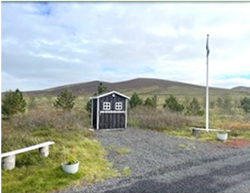
Mynd 7 Kerbúðin – handverksverslun

Vegir innan Kerhrauns eru um 4 m breiðir og fjölförnustu vegakaflarnir eru með bundnu slitlagi. Við mörk vegar og lóðar skal vera 4 m helgunarsvæði fyrir lagnir og þar er ekki gert ráð fyrir trjágróðri. Afmarka skal tvö bílastæði á lóð. Tvö sameiginleg bílastæði skulu liggja við leik- og útivistarsvæði, einnig skal vera geymsluplan fyrir eigur félagsins og afmarkað svæði fyrir litla færanlega handverksverslun.