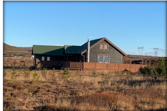
Mynd 12 Í Kerhrauni er að finna fjölbreytt frístundahús