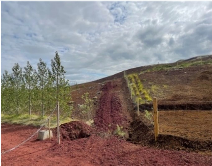
Mynd 10 Flóttaleið út af svæðinu

Gert er ráð fyrir göngustígum um svæðið, bæði um leik- og útivistarsvæði og einnig á milli lóða. Þar sem girðingar eru í beinu framhaldi af stígum, skulu vera stigar yfir girðingarnar, bæði sem flóttaleið og til að auðvelda fólki för að læknum eða á önnur opin svæði. Ein viðurkennd og merkt flóttaleið er út af svæðinu á Búrfellsveg, þ.e á milli lóða nr. 82 og 83.