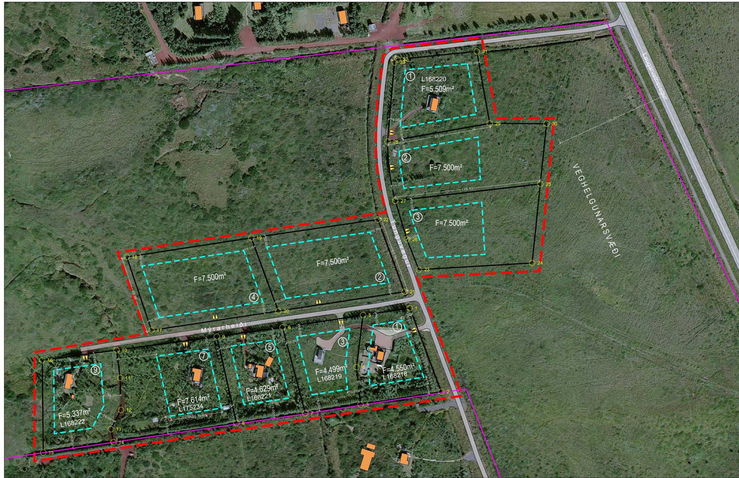
Deiliskipulag - mkv. 1:2.000