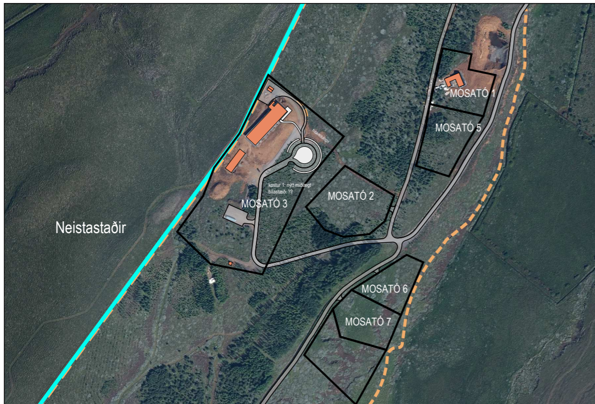
Yfirlitsmynd - 1:5.000