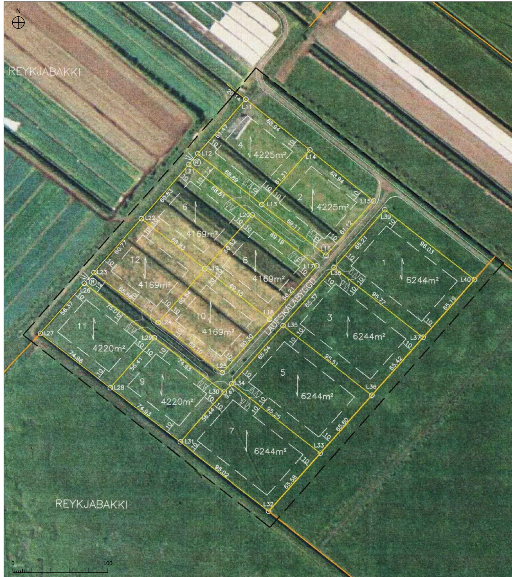
GILDANDI DEILISKIPULAGSUPPRÁTTUR 1:2000. SAMÞYKKT AF SKIPULAGSFULLTRÚA UPPSVEITA ÁRNESSÝSLU 2. NÓVEMBER 2006