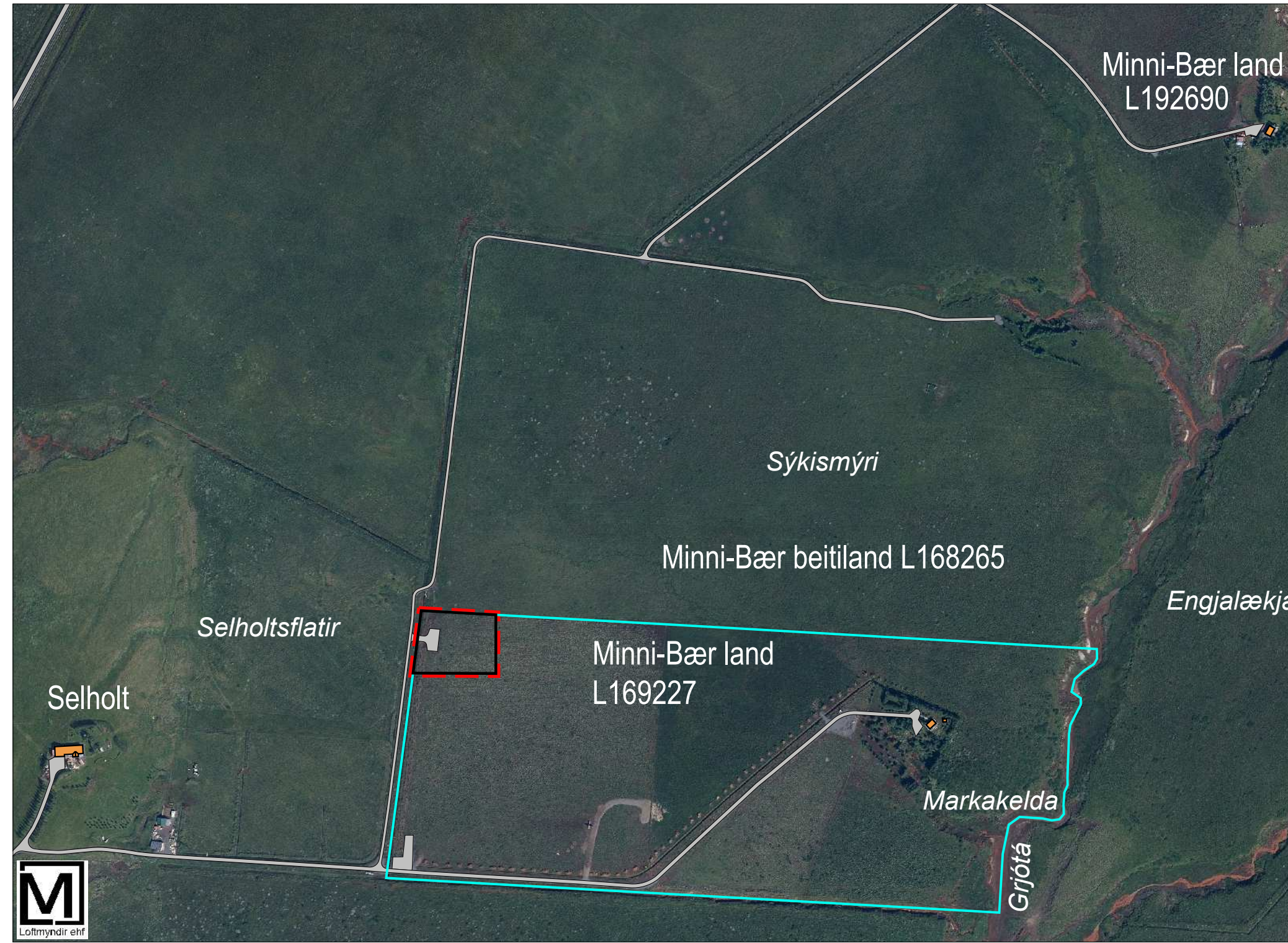
Yfirlitsmynd - mkv. 1:5.000

Deiliskipulag þetta sem auglýst hefur verið skv. 1. mgr. 41. gr. skipulagslaga nr. 123/2010 m.s.br. frá _____ til _____ var samþykkt í sveitastjórn Grímsnes- og Grafningshrepps þann _____