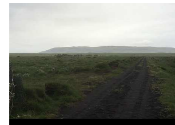
Yfirlitsmynd, horft til austurs, Vörðufell í baksýn

Að öðru leyti skulu allar byggingar og staðarval þeirra vera í samræmi við gildandi Skipulags- og mannvirkjalög.