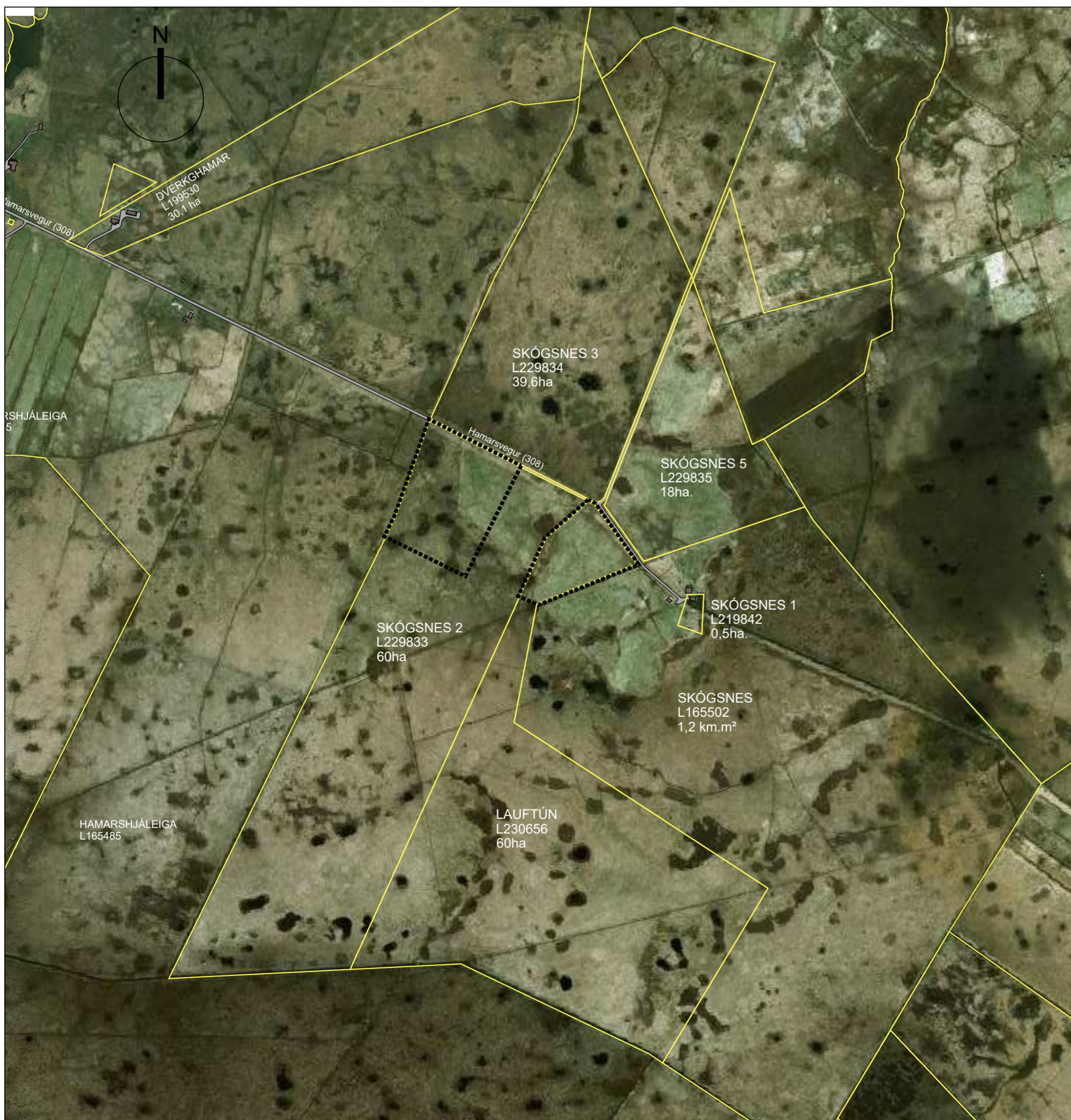
Afstöðumynd í mkv. 1 : 10.000

Deiliskipulag þetta hefur verið auglýst skv. 1.mgr. 41.gr. skipulagslaga nr. 123/2010 var samþykkt í sveitarstjórn Flóahrepps þann _____ 2021.