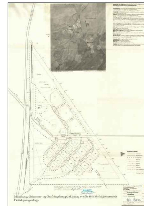
Deiliskipulag hannað af Birni Jóhannssyni landslagsarkitekt, samþykkt 3. júlí 2001

Að öðru leyti gilda áfram í breyttu skipulagi deiliskipulagsskilmálar í samþykktu skipulagi frá 3. júlí 2001 m.s.br.