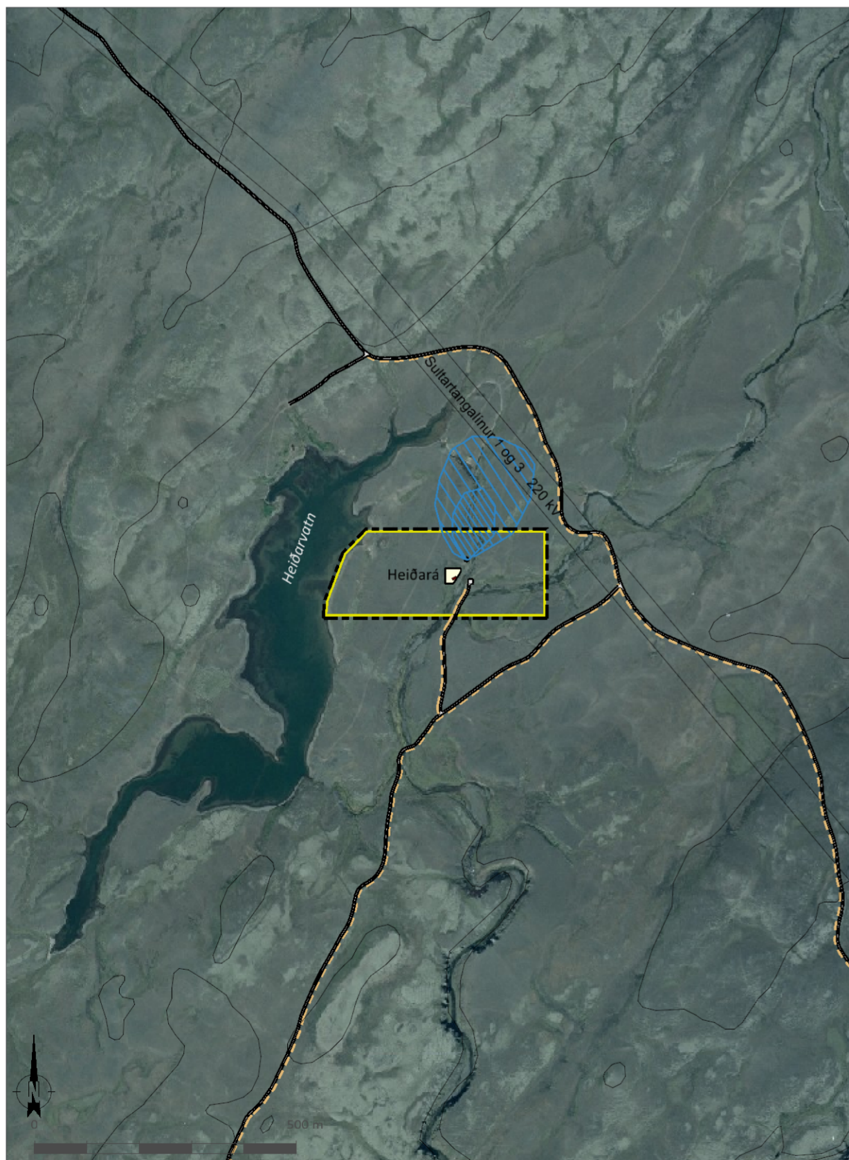
Skýringaruppráttur í mkv. 1:10.000.