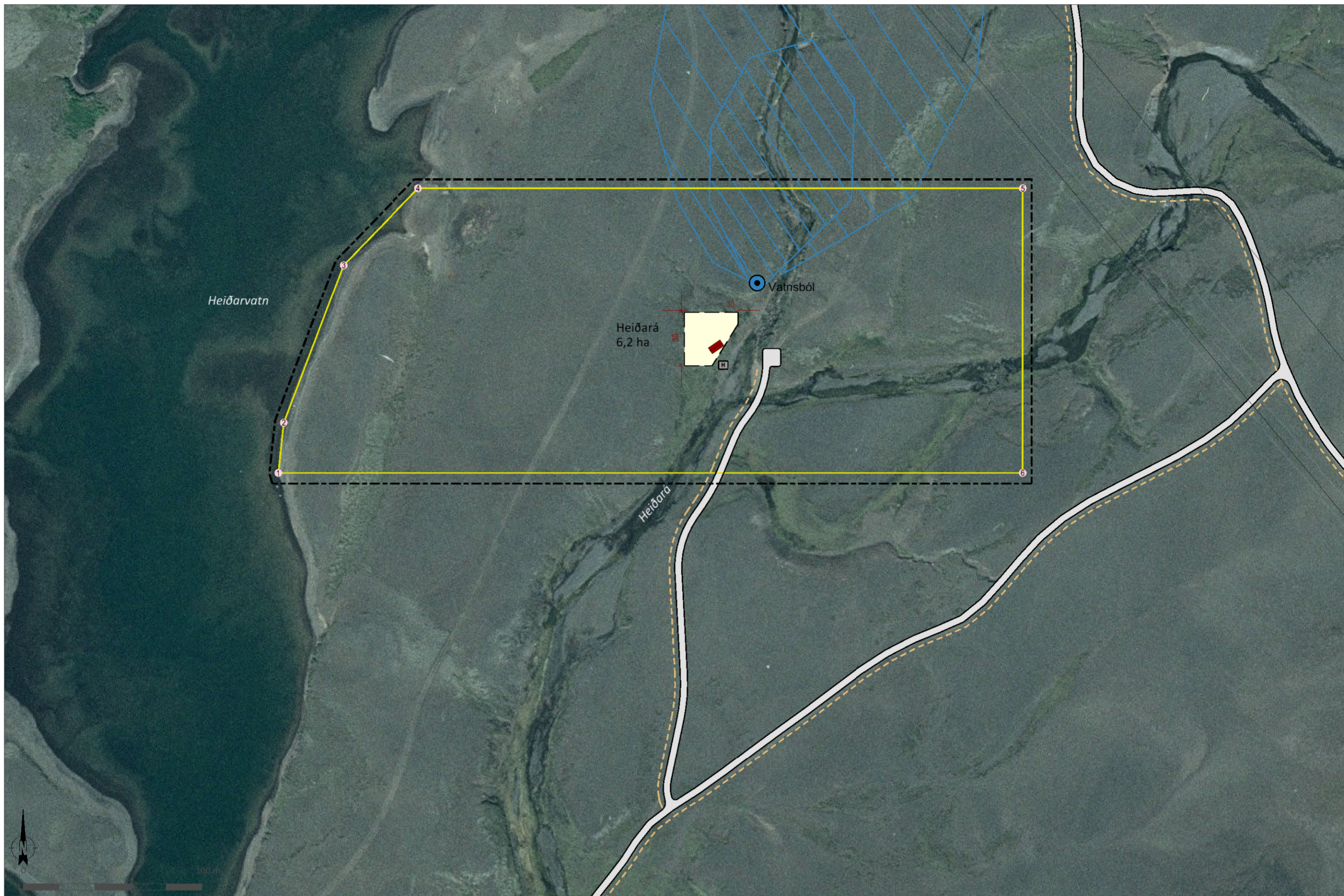
Deiliskipulagsuppráttur í mkv. 1:2.000.