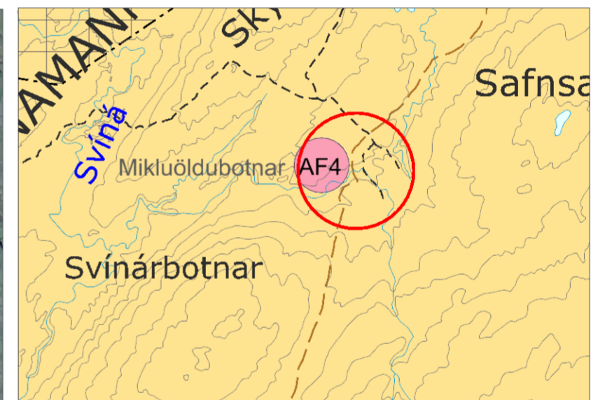
Aðalskipulag Hrunamannahrepps 2016-2032, afréttur. Mkv. 1:100.000.

Heimilt er að stækka núverandi gistaðstöðu um allt að 100 m 2 og byggja nýtt hús allt að 100 m 2 . Gisting getur verið fyrir allt að 30 gesti. Mænishæð getur verið allt að 5,5 m m.v. gólfkóta. Heimilt er að vera með salerni í viðbyggingu/nýjum skála.