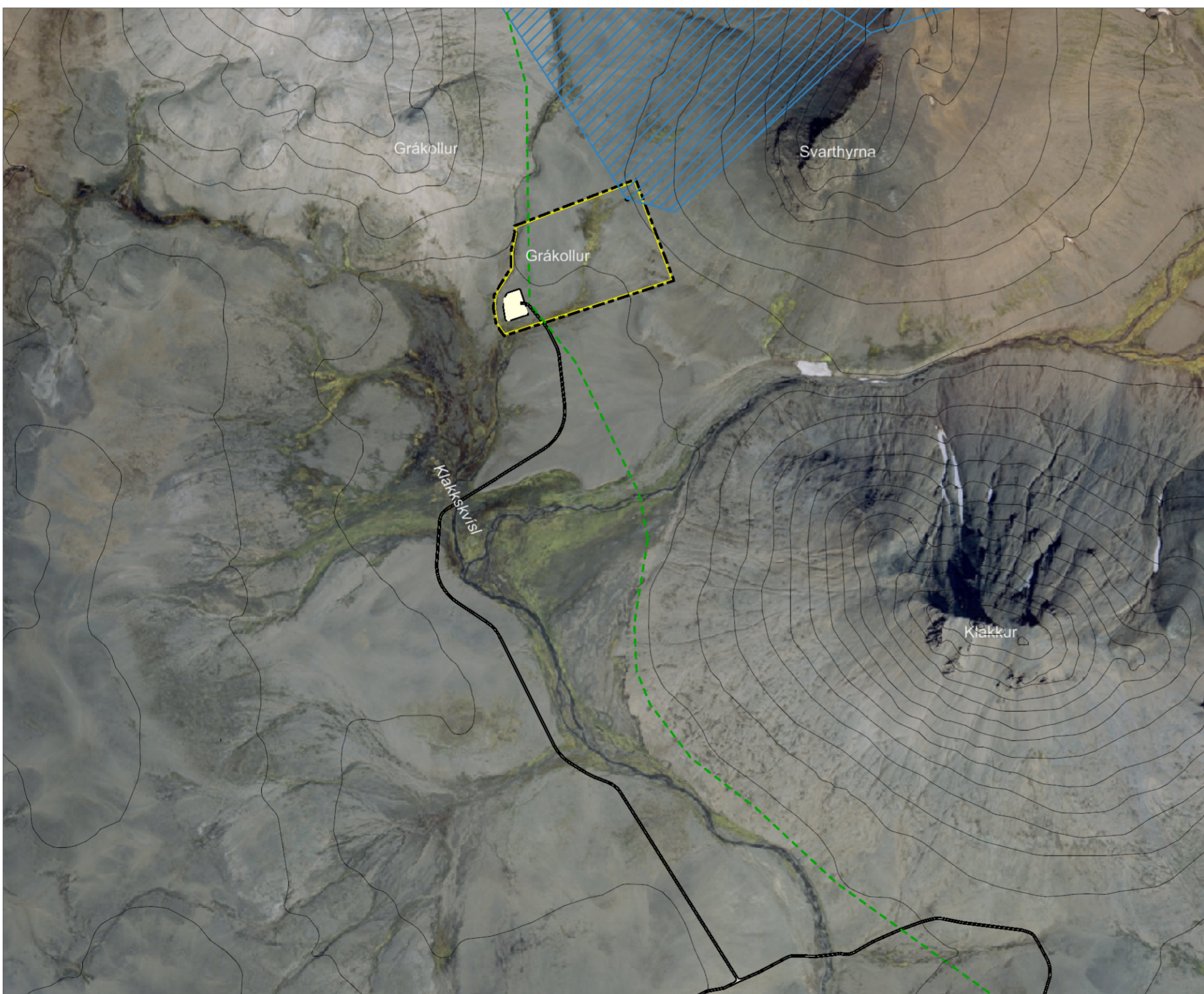
Skýringaruppráttur í mkv. 1:10.000.

Skipulagslýsing var auglýst frá 24.07.2019 til 14.08.2019. Deiliskipulagstillagan var kynnt frá 18.12.2019 til 08.01.2020. Deiliskipulagstillagan var auglýst frá _____ til _____