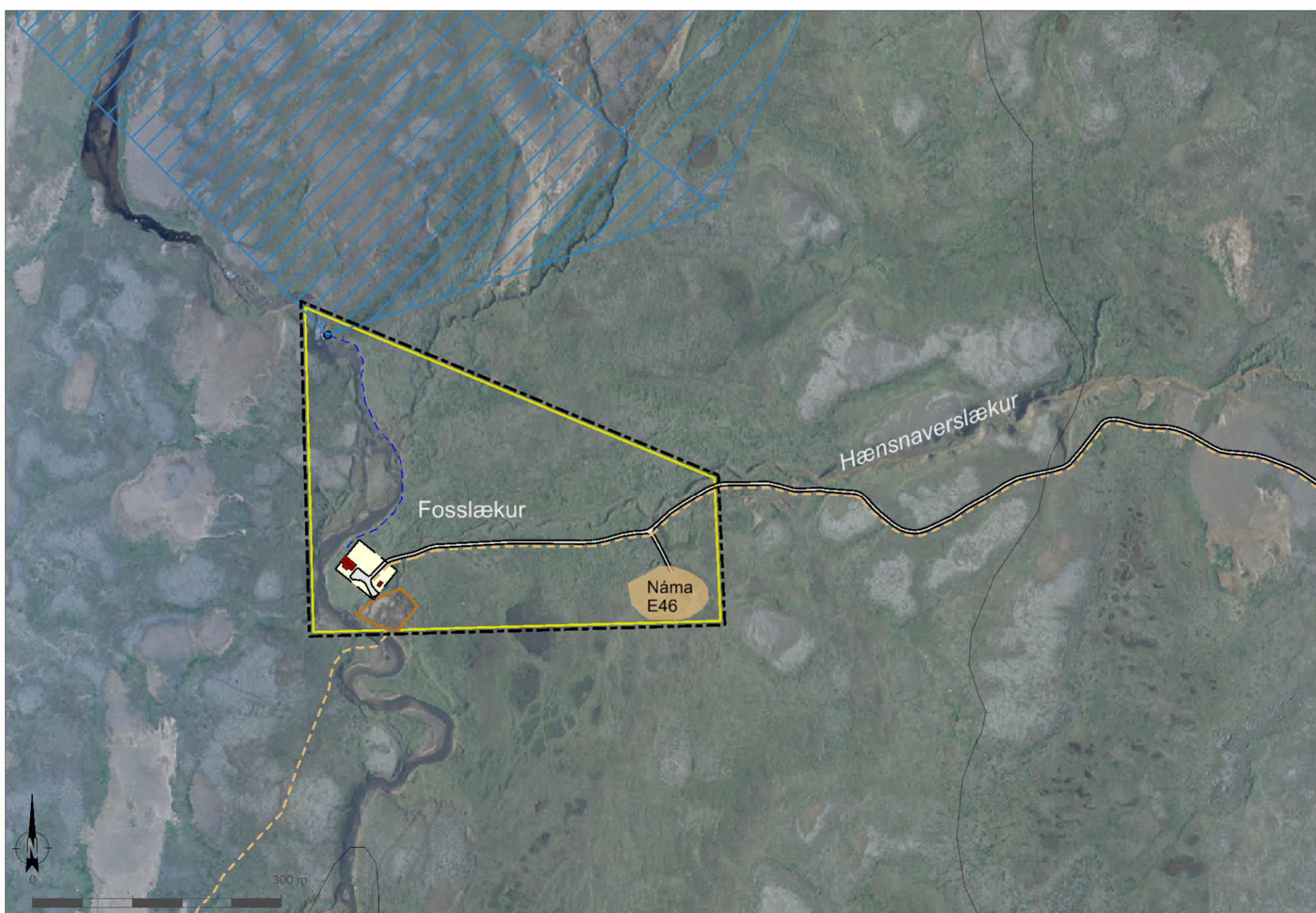
Skýringaruppráttur í mkv. 1:6.000.