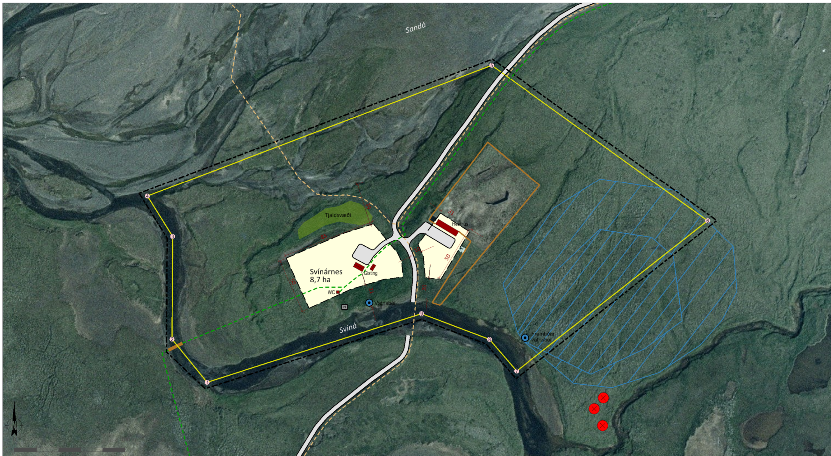
Deiliskipulagsuppráttur í mkv. 1:2.000.