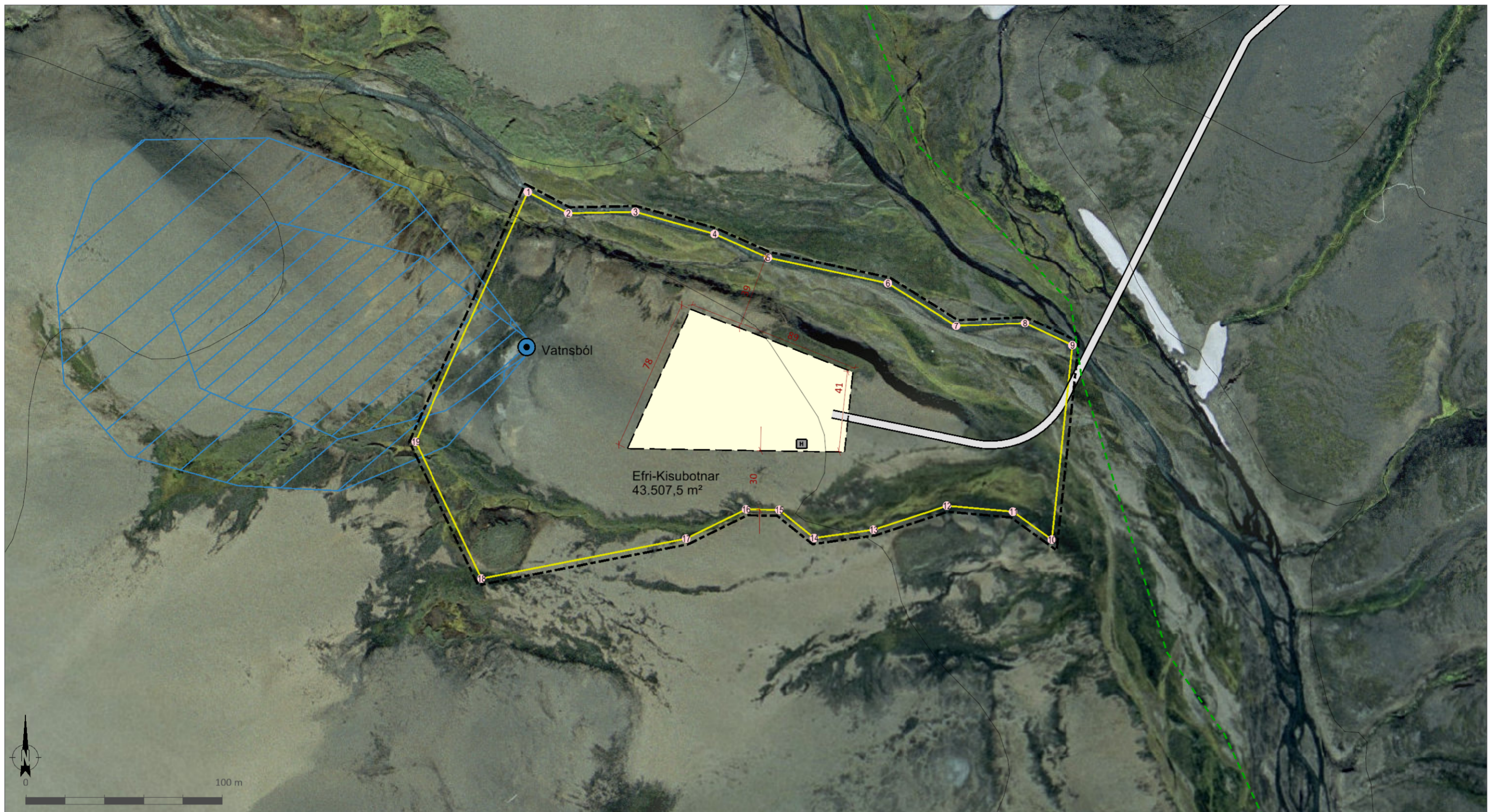
Deiliskipulagsuppráttur í mkv. 1:2.000.