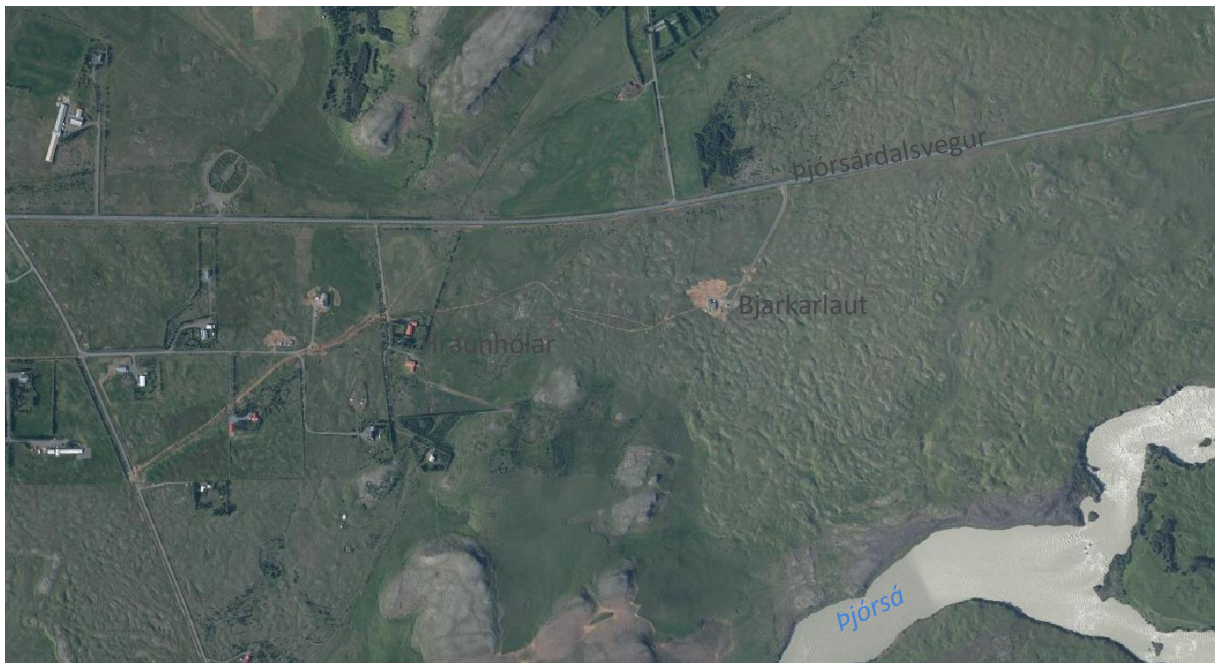
Mynd 2. Yfirlitsmynd yfir svæðið (Map.is 2 )

Svæðið er nokkuð flatlent og að mestu grasi vaxið og að hluta til gömul tún. Trjám hefur verið plantað til skjólmyndunar.