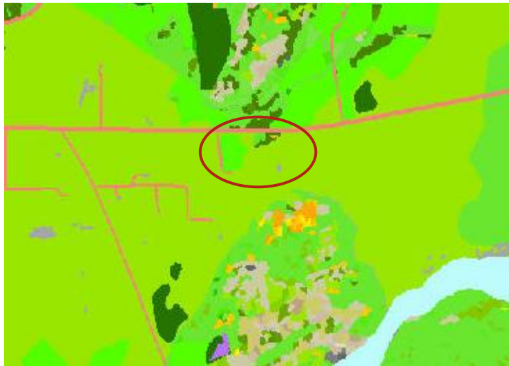
MYND 4. Vistgerðarkort Náttúrufræðistofnun Íslands, svæðið er innan rauða hringsins.

Vistgerðir á svæðinu eru að mestu leyti til tún og akurlendi (L14.2) og mosamóavist (L10.1) sem er með lágt verndargildi. Einnig er þar að finna víðikjarrvist (L10.10) sem er með mjög hátt verndargildi en nokkuð mikla útbreiðslu á landsvísu, língresis- og vingulsvist (L9.6) sem er með hátt verndargildi og á lista Bernarsamningsins en vingulvist hefur mjög mikla útbreiðslu á landsvísu 4 . Hafa ber í huga að nákvæmni korts Náttúrufræðistofnunar miðast við mælikvarða 1:25.000 og gefur því gott yfirlit yfir vistgerðir svæðisins.