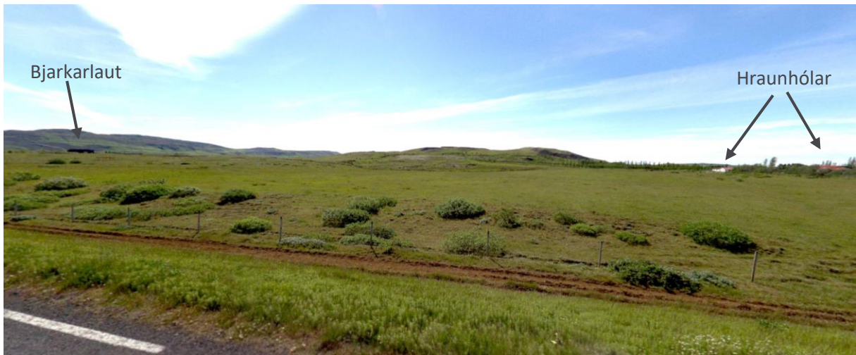
MYND 3. Horft yfir svæðið frá Þjórsárdalsvegi. Hraunhólar til hægri en Bjarkarlaut til vinstri

Svæðið er nokkuð flatlent og að mestu grasi vaxið og að hluta til gömul tún. Trjám hefur verið plantað til skjólmyndunar.