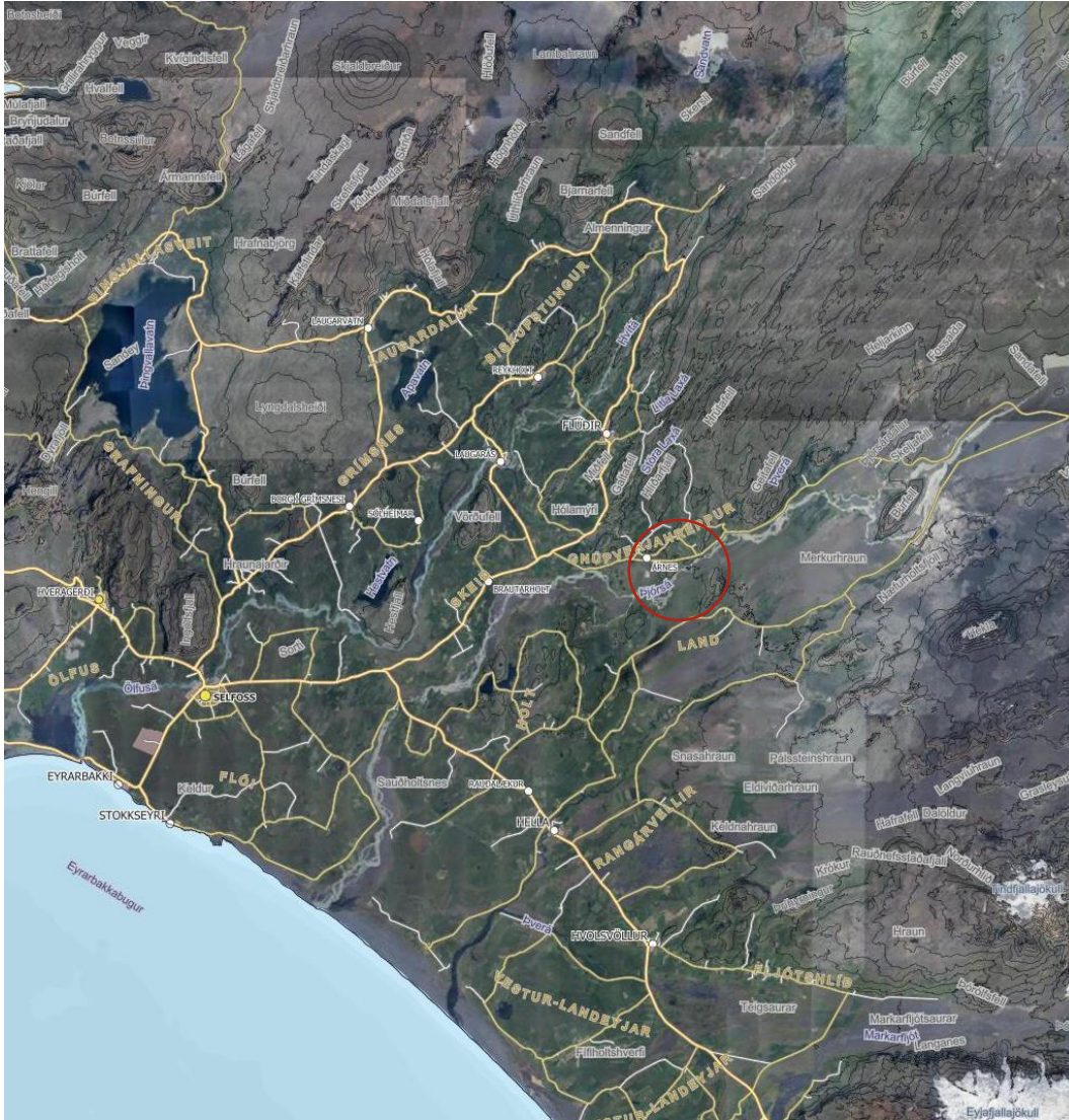
MYND 1. Staðsetning svæðisins er innan rauða hringsins (Map.is 1 ).

Svæðið liggur sunnan Þjórsárdalsveggar nr. 32 með aðkomu um núverandi vegtengingu að Hraunhólum vestan til en um vegtengingu Bjarkarlaut til.