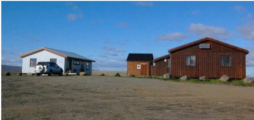
MYND 1. Árbúðir í Bláskógabyggð. Hrefnubúðakaffi t.v. og sæluhúsið t.h. Þar á milli er snyrting.

Árbúðir eru við Kjalveg, skammt norðan við Hvítá. Aðkoma er af Kjalvegi. Árbúðir voru byggðar árið 1992 af Biskupstungnahreppi (nú Bláskógabyggð) og veiðifélagi Hvítárvatns. Staðurinn er skráður í Þjóðskrá 1 , landnr. 167350. Stærð lóðar er skráð 2.500 m 2 og þar er 87 m 2 sæluhús, 85 m 2 söluskáli og