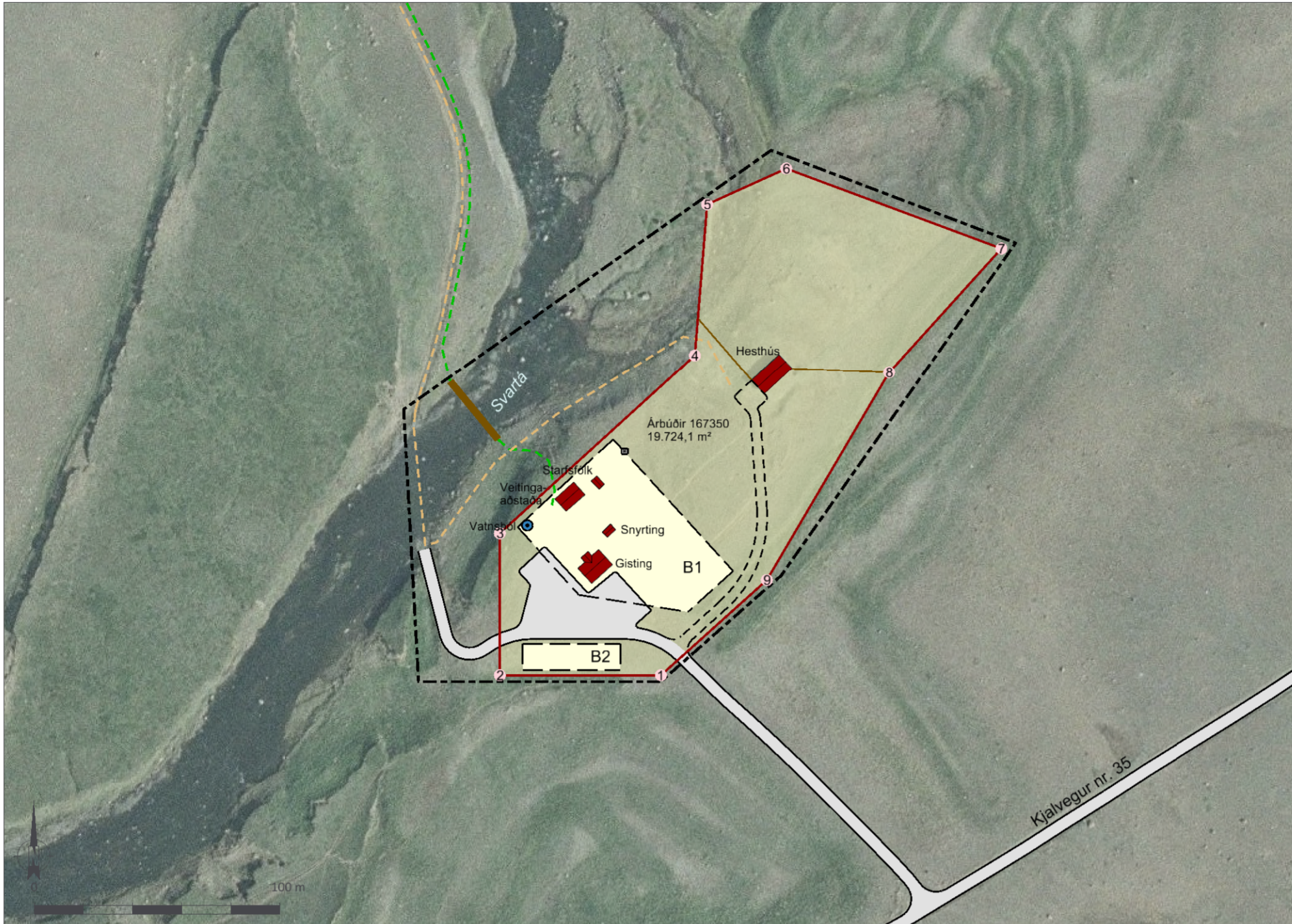
Deiliskipulagsuppráttur í mkv. 1:2.000.