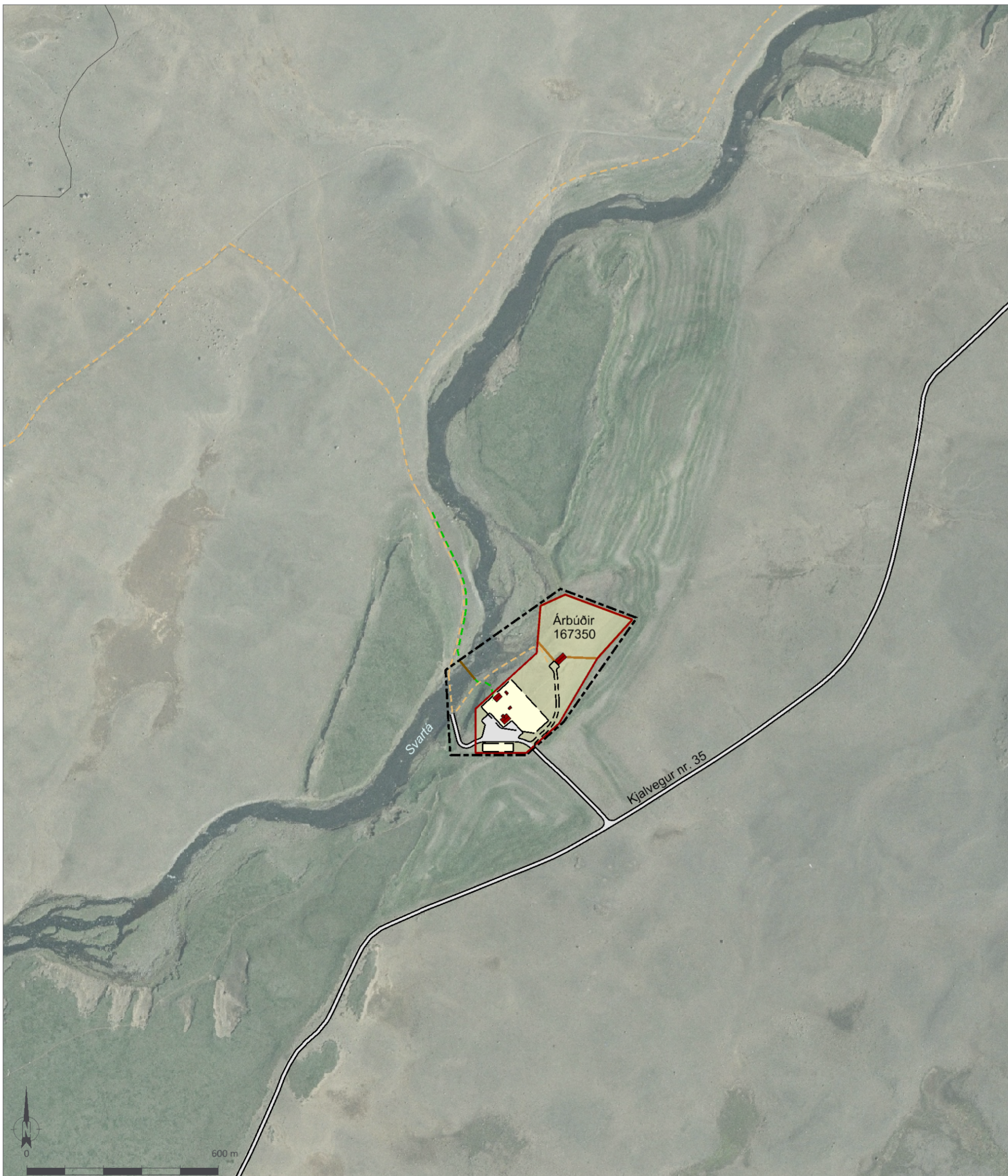
Skýringaruppráttur í mkv. 1:5.000.