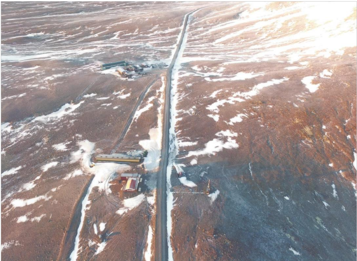
MYND 1. Horft til vesturs yfir núverandi mannvirki sunnan undir Geldingafelli. Geldingafell er hægra megin við Skálpanesveg.

Svæðið er lítt gróið og vistgerðir á svæðinu eru melar- og sandlendi, skv. vistgerðarkortlagningu Náttúrufraeðistofnunar. Svæðið er í um 600 m.h.y.s.