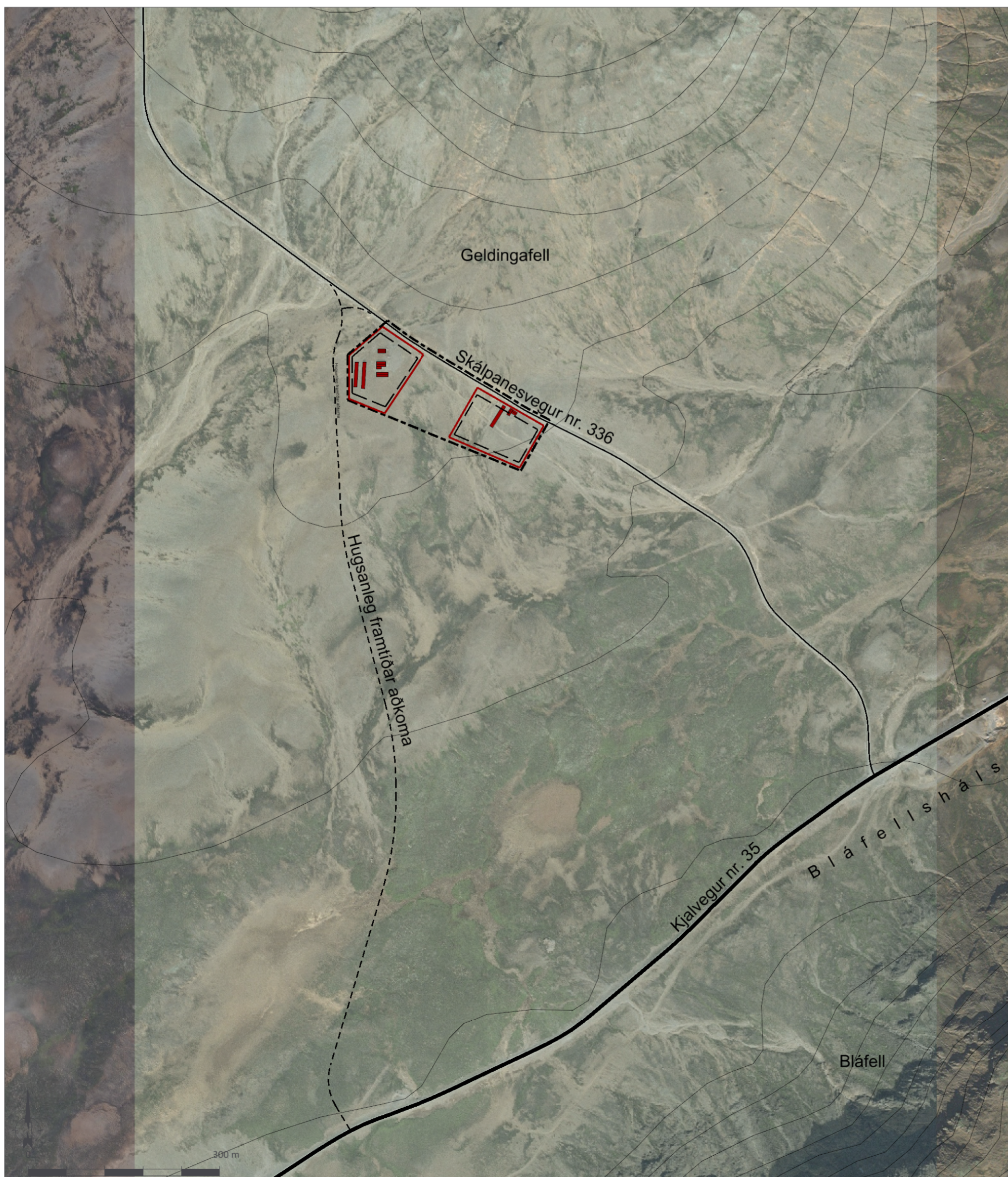
Skýringaruppráttur í mkv. 1:6.000.