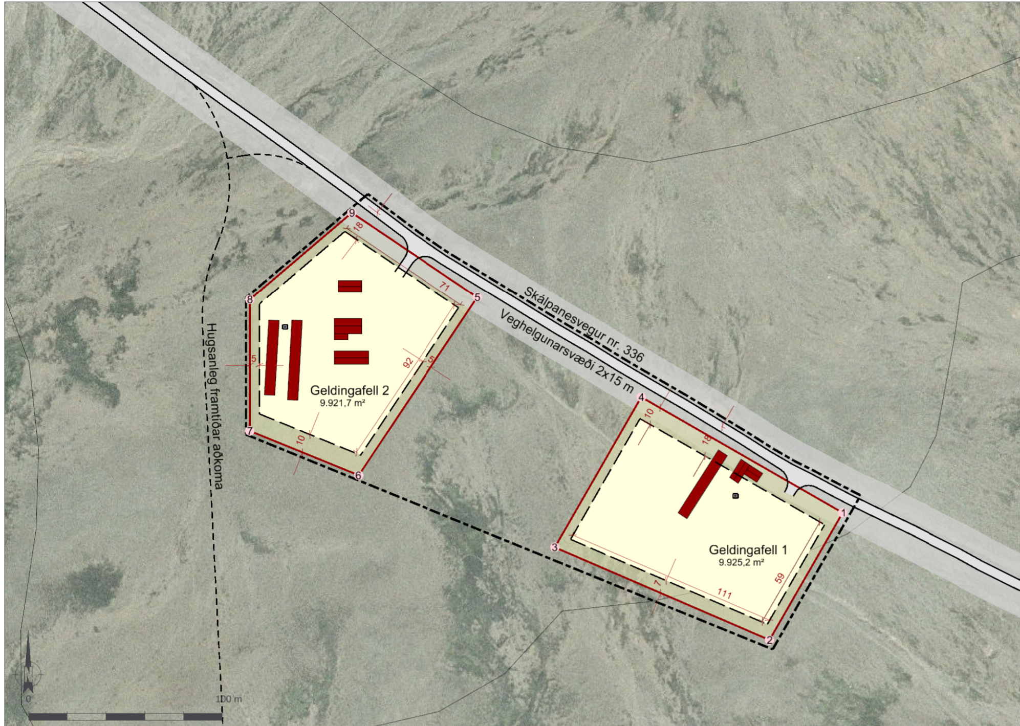
Deiliskipulagsuppráttur í mkv. 1:2.000.